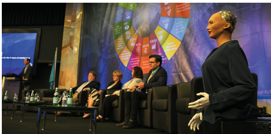
Sophia Hanson, en menneskelignende robot udviklet af firmaet Hanson Robotics fra Hongkong, er designet til at kommunikere og arbejde sammen med mennesker. I oktober 2017 fik den statsborgerskab i Saudi-Arabien, og den er dermed verdens første robot med statsborgerskab. Foto: Sophia taler på "AI for GOOD Global Summit", ITU, Genève, Schweiz, 7.-9. juni, 2017.

Det er spekulativt, at dette skulle blive anvendt bevidst af myndigheder og laboratoriefolk, men der findes mange indicier på, at det kan hænge sådan sammen. Det