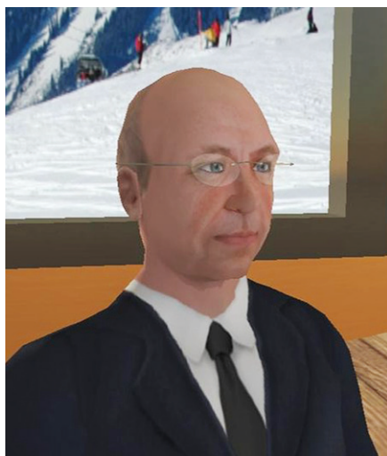
„Second Life Avata of Klaus Schwab“, stifter og bestyrelsesformand for „World Economic Forum“.

Den rette forståelse af "teori" fra en videnskabsteoretisk synsvinkel er dog med Aristoteles som oprindelig inspirationskilde, at teori er filosofi eller forsøg på konceptualisering af den ikke-konkrete del af virkeligheden. Og derudover kombinerer vi vores udsyn og faktuelle forhold heri på nye analytiske måder for hermed at kunne iagttage, hvad der foregår.