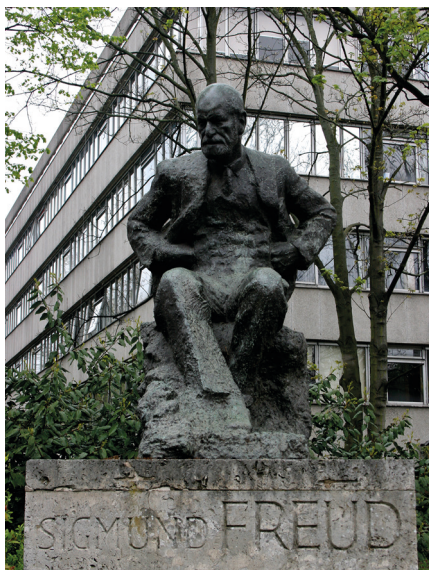
Statue af Sigmund Freud i London, med Tavistock-klinikken i baggrunden.

Alle, der har læst om diskurs og magt i deres videnskabsteori eller humanistiske studielinjer, kender til, at diskurser kan anvendes effektivt med et magtmæssigt formål. I dette tilfælde er der tale om politisk diskurs og mediediskurs, samt om “nudging”, dvs. konkrete tiltag, der skal få folk til at handle på bestemte måder.