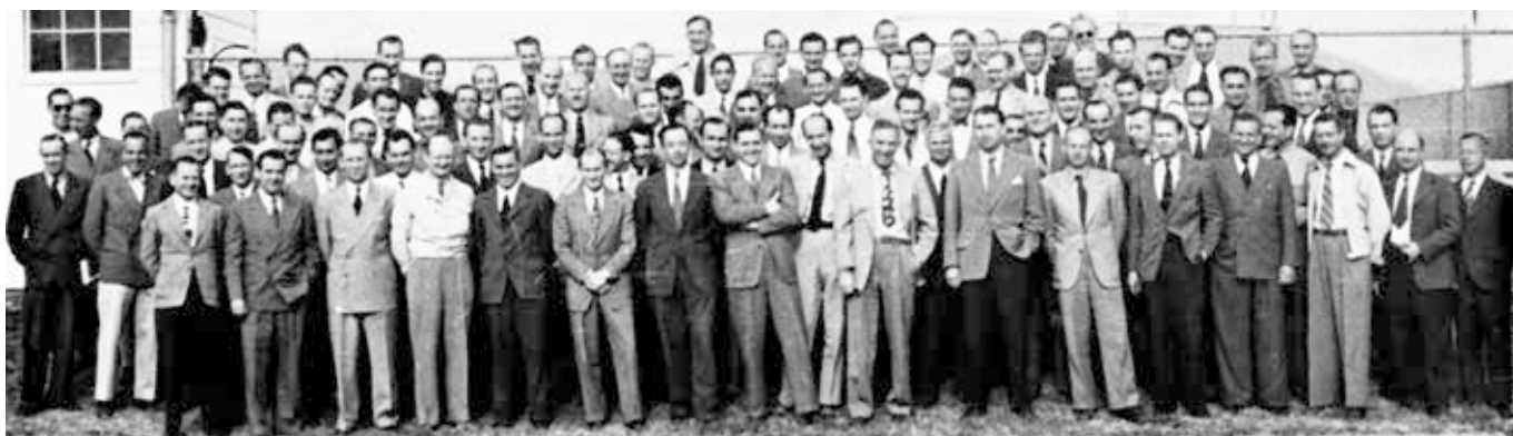
Med den hemmelige mission Operation Paperclip fik den Amerikanske regering hentet flere en 1.600 Nazi forskere (og deres familier) til USA. Herved blev viden, erfaring og forskning indenfor avanceret militær teknologi, flyteknologi, kemiske og biologiske våben bragt til landet. Velvidende, og sløret, at en del af disse forskere havde været involveret i eksperimenter på mennesker som var de laboratorierotter.

der stadig mere indpas i takt med, at hele den teknisk-instrumentelle og økonomiske management-tankegang i stigende grad etablerer sig som den primære retningsgiver, og som en primær og ofte usagt underliggende filosofi i mange moderne nationer.