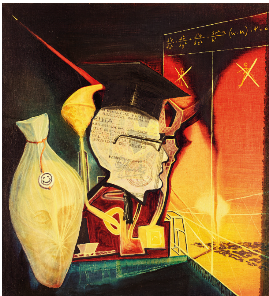
„Spyros Koukoulomatis Technocrat“ af Yannis Zannias Creative Commons.

onslejlre, organiserede videnskabelige, medicinske forsøg, samt prøvesprængning af atombomben i Japan.