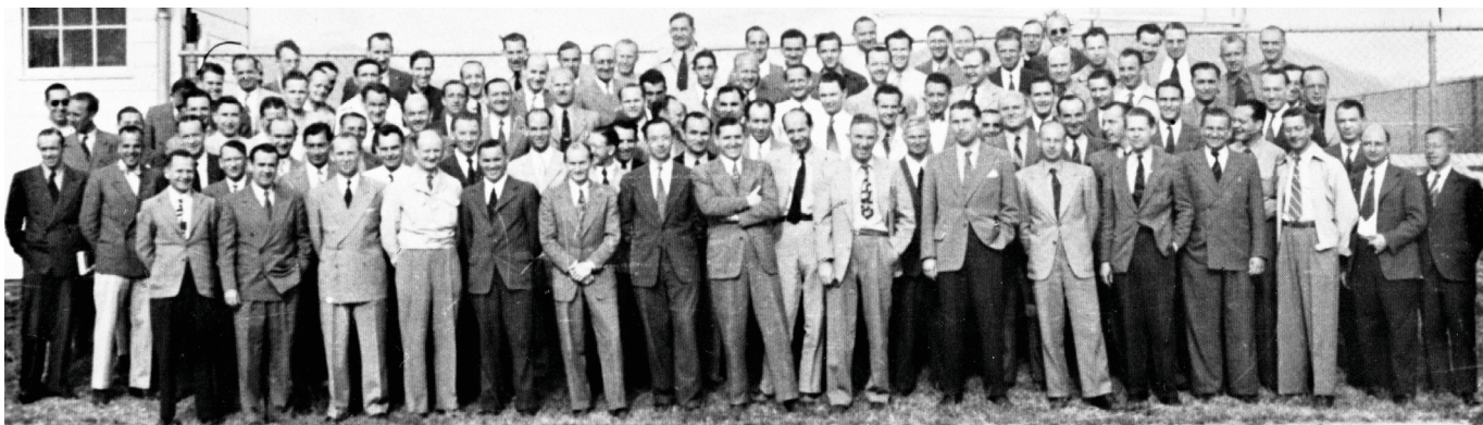
Med den hemmelige mission Operation Paperclip fik den Amerikanske regering hentet flere en 1.600 Nazi forskere (og deres familier) til USA. Herved blev viden, erfaring og forskning indenfor avanceret militær teknologi, flyteknologi, kemiske og biologiske våben bragt til landet. Velvidende, og sløret, at en del af disse forskere havde været involveret i eksperimenter på mennesker som var de laboratorierotter.

der stadig mere indpas i takt med, at hele den teknisk-instrumentelle og økonomiske management-tankegang i stigende grad etablerer sig som den primære retningsgiver, og som en primær og ofte usagt underliggende filosofi i mange moderne nationer.