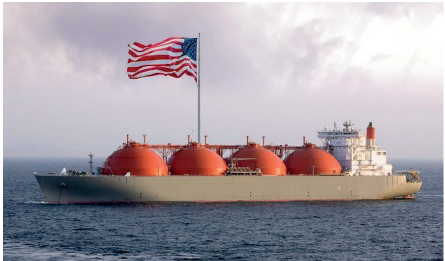
Amerikanischer LNG Tanker

Die mittelalterlichen Kirchen im Westen wurden ihrer Almosen und Stiftungen beraubt, um dem Papsttum den Peterspfennig