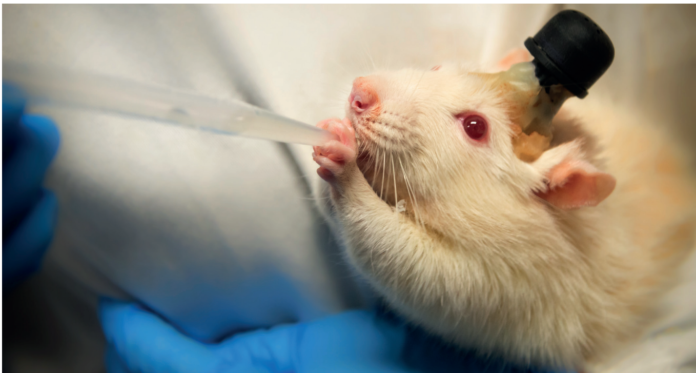
Laboratorierotte med et hjerneimplantat, der blev brugt til at registrere in vivo (i levende organisme, red.) neuronal aktivitet under en bestemt opgave.