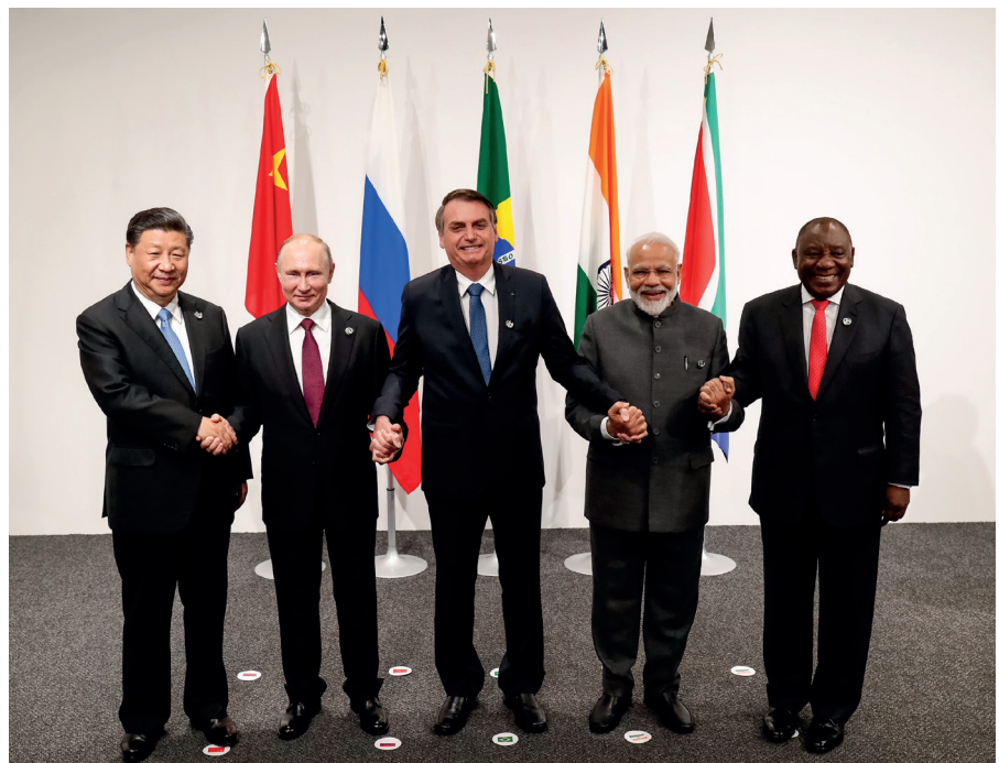
Die Landescheffs der BRICS-Staaten (v.l.n.r): Xi Jinping (China), Wladimir Putin (Russland), Jair Bolsonaro (Brasilien, bis Oktober 2022), Narendra Modi (Indien) und Cyril Ramaphosa (Südafrika)

Trotz großer Herausforderungen – von Null-Covid über verschiedene Sanktionen