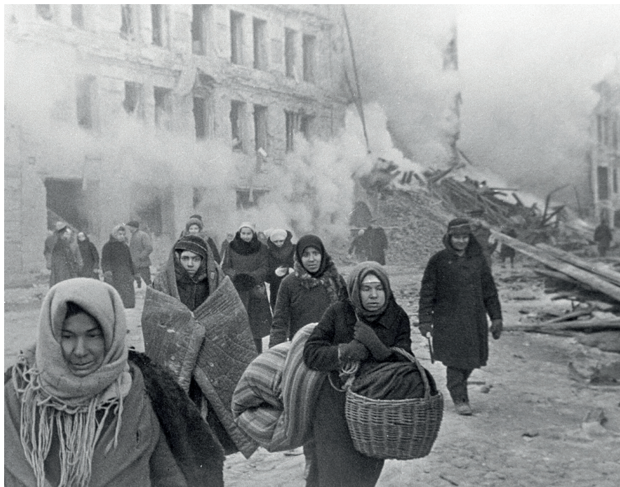
Sovjetiske civile forlader deres ødelagte huse efter et bombardement fra den tyske hær under kampen om Leningrad, 10.12.1942.

Den 22. juni, 1941, invaderede Wehrmacht Sovjetunionen med ca. 3.000.000