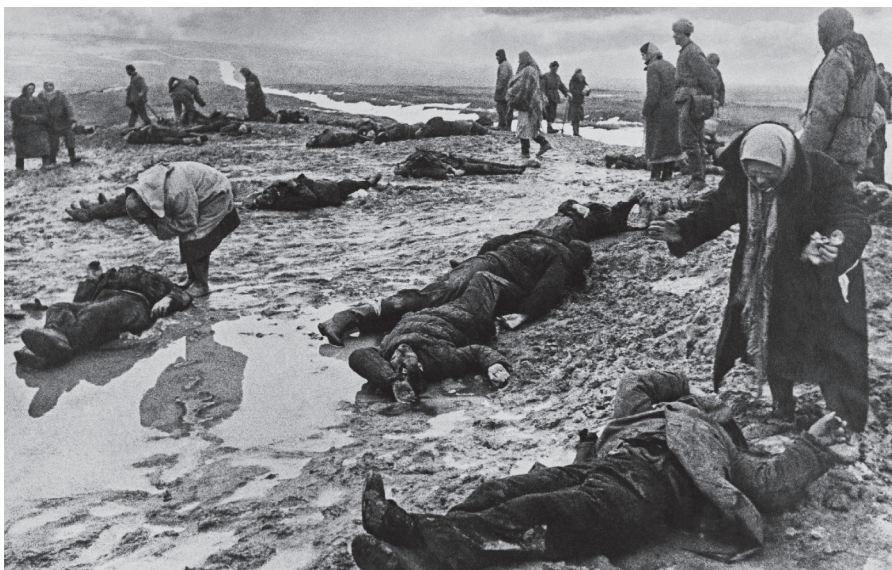
Russiske mødre fjerner ligene fra slagmarken efter slaget ved Kerch, i 1942.

Denne tekst blev første gang offentliggjort på www.nachdenkseiten.de under følgende URL https://www.nachdenkseiten.de/?p=84845 den 15.6.2022. Licens: Leo Ensel, NachDenkSeiten, CC BY-NC-ND 4.0