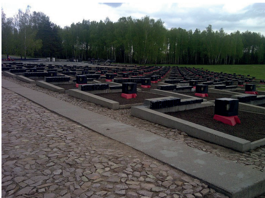
Kirkegård for landsbyer i mindesavmærket Khatyn: 186 grave, en for hver landsby.

Det systematiske massebord på de europæiske jøder begyndte på Sovjetunionens territorie. I begyndelsen var der tale om isolerede og frygteligt brutale anti-jødiske pogromer, som blev udført af lokalbefolkningerne, især i Litauen, Letland og den vestlige del af Ukraine. Mens disse begivenheder, som SS beskrev som „selvrensningsspraksis“, udspillede sig, så Wehrmachts besættelsesstyrker, selv om de var juridisk ansvarlige, passivt til. Pogromerne blev snart efterfulgt af systematiske henrettelser udført af sikkerhedspolitiet og specialstyrker. Selv om henrettelserne i begyndelsen var begrænset til jødiske mænd, der var kvalificerede til at gøre militærtjeneste, blev hele jødiske samfund senest fra august 1941 udryddet. Hver hviderussisk eller ukrainsk by, uanset hvor lille den var, led tusindvis af ofre. Ifølge skøn myrdede de tyske besættelse mellem 2,5 og 2,6 millioner sovjetiske jøder. Meget ofte ydede Wehrmacht logistisk støtte. Det morderiske samarbejde mellem Wehrmacht, SS og de almindelige nazistiske politi-styrker fulgte et lignende mønster under kampen mod partisanerne. Mellem 1942 og 1943 blev især i Hviderusland hele regioner omdannet til „ørkenområder“. Tusindvis af landsbyer blev brændt ned, hundredvis af dem sammen med byernes befolk-