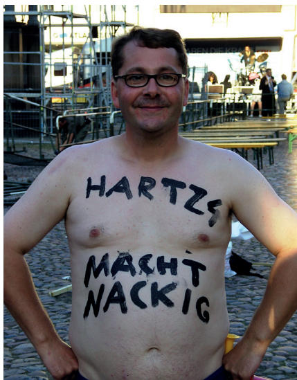
Protest - "Hartz 4 macht nackig", 2009

Begründet wird der Handlungsbedarf zur Reform des SGB II mit der Problemstellung des Gesetzes: „Im August 2022 erhalten rund 5,4 Millionen Menschen in Deutschland Leistungen der Grundsicherung für Arbeitssuchende. In den 405 Jobcentern werden erwerbsfähige und nicht erwerbsfähige Leistungsberechtigte in ganz unterschiedlichen Lebenslagen beraten und gefördert. Dazu gehören Langleistungsbeziehende, Alleinerziehende, Menschen ohne Schul- oder Berufsabschluss, Menschen mit gesundheitlichen Einschränkungen, Geflüchtete, aber auch Beschäftigte und Menschen, die vorübergehend hilfebedürftig sind. Die Jobcenter unterstützen zielgerichtet die rund 3,8 Millionen erwerbsfähigen Leistungsberechtigten bei der Arbeits- und Ausbildungsmarkintegration.“