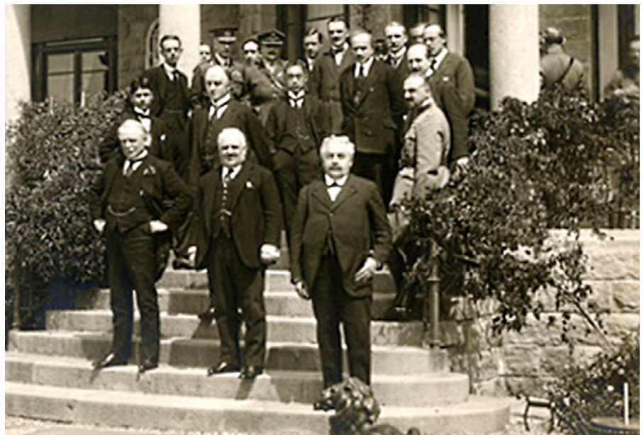
Die Konferenz von Genua 1922. Lloyd George in der ersten Reihe, links.

Und auch schon in der Eröffnungszeremonie, feierlich begleitet von katholischen Bischöfen, erwiesen sich die