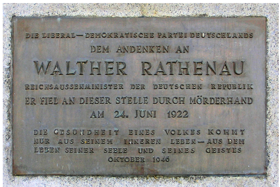
Gedenktafel, Walther Rathenau, Königsallee 16, Berlin-Grünwald, Deutschland am 19.05.2009

Auch am Samstag, dem 24. Juni 1922, muss Rathenau ein paar Stunden arbeiten. Er soll in den Räumen des Außenministeriums vormittags einer Prüfung von jungen Anwärtern für den diplomatischen Dienst beiwohnen. Die Nacht zuvor hat Rathenau wieder mal durchgemacht. Zuerst war er bei dem Botschaf-