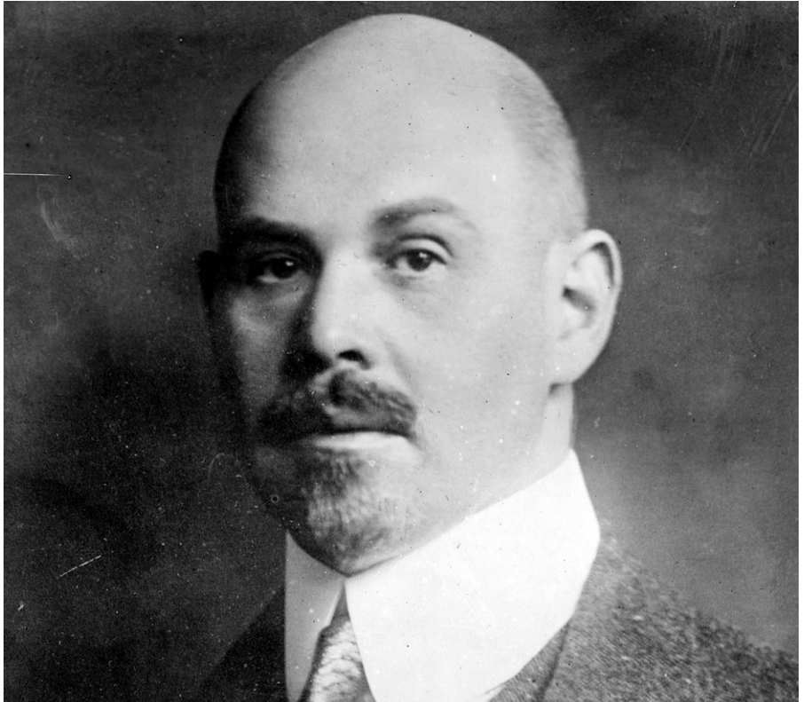
Walther Rathenau, deutscher Industrieller und Politiker, 1867-1922