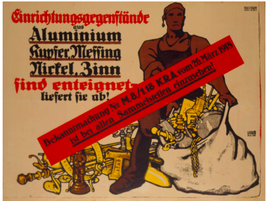
Bekanntmachung der Kriegsrohstoffabteilung, 1918 (Poster: Louis Oppenheimr, Wikimedia Commons,CC-PD-Mark)

Rathenau hatte die Kriegsrohstoffabteilung schon im Jahre 1915 wieder verlassen. Typisch Rathenau: Wenn er ein Unternehmen erfolgreich in die Welt gesetzt hat, das selbst weiter laufen kann, dann wendet sich der rührige Unternehmer dem nächsten Projekt zu. In diesem Falle wurde Rathenau nach dem Ableben seines Vaters Emil dringend an der Spit-