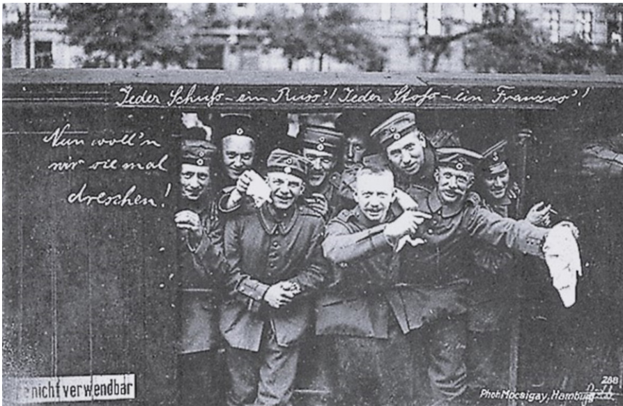
Wohlfahrts-Karte des Vaterländischen Frauenvereins, Provinzialvereins Berlin zum Besten der Kriegsfürsorge um 1914

von Salpeter und natürlichem Ammoniak durch die Seeblockade absperren. In nicht allzu ferner Zukunft müsste dann Deutschland kapitulieren. Ganz einfach, weil den Streitkräften die Munition ausgegangen ist! Man sieht, unsäglich blöde Politiker und Militärs hat es auch früher schon gegeben. Rathenau sucht den Oberbefehlshaber der kaiserlichen Streitkräfte umgehend auf und überreicht ihm sein Memorandum [5].