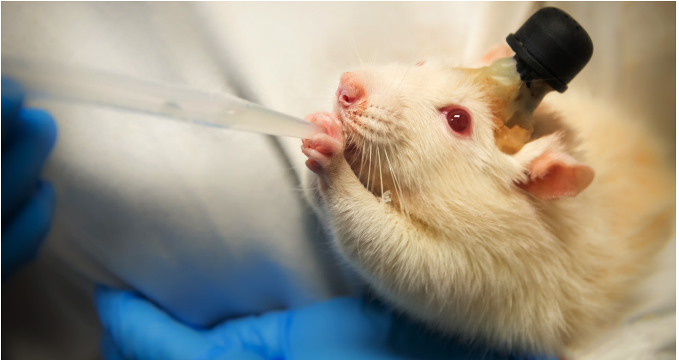
Laboratorierotte med et hjerneimplantat, der blev brugt til at registrere in vivo (i levende organisme, red.) neuronal aktivitet under en bestemt opgave.