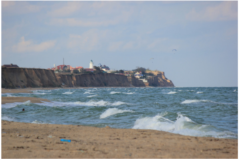
Die Schwarzmeerküste bei Tschornomorsk südlich von Odessa am 27.9.2014.