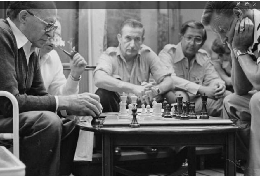
Menachem Begin und Zbigniew Brzezinski spielen während des Camp-David-Gipfels Schach, am 9.9.1978

Die Implikationen sind klar. So sehr Washington und die NATO auch immer „verzweifelter versuchen, die Situation so weit wie möglich zu verschlimmern“ (und das ist Plan A: es gibt keinen Plan B), so sehr verschärfen die Amerikaner auf geoökonomischer Ebene das „neue große Spiel“: Verzweiflung bezieht sich hier auf den Versuch, die Energiekorridore zu kontrollieren und deren Preis zu bestimmen.