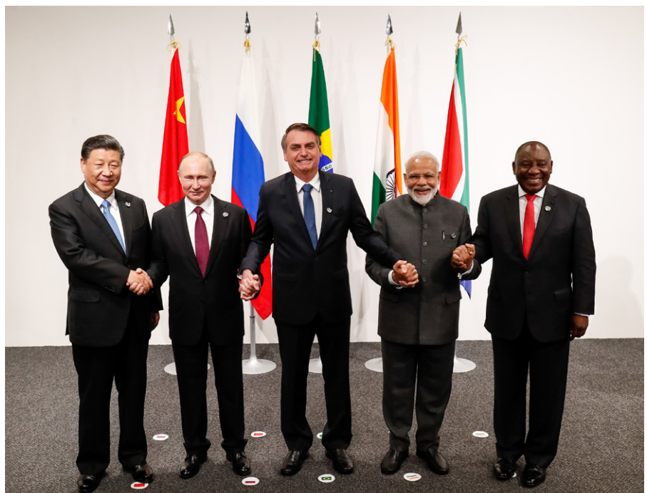
Die Landeschefs der BRICS-Staaten (v.l.n.r): Xi Jinping (China), Wladimir Putin (Russland), Jair Bolsonaro (Brasilien, bis Oktober 2022), Narendra Modi (Indien) und Cyril Ramaphosa (Südafrika)

Trotz großer Herausforderungen – von Null-Covid über verschiedene Sanktionen