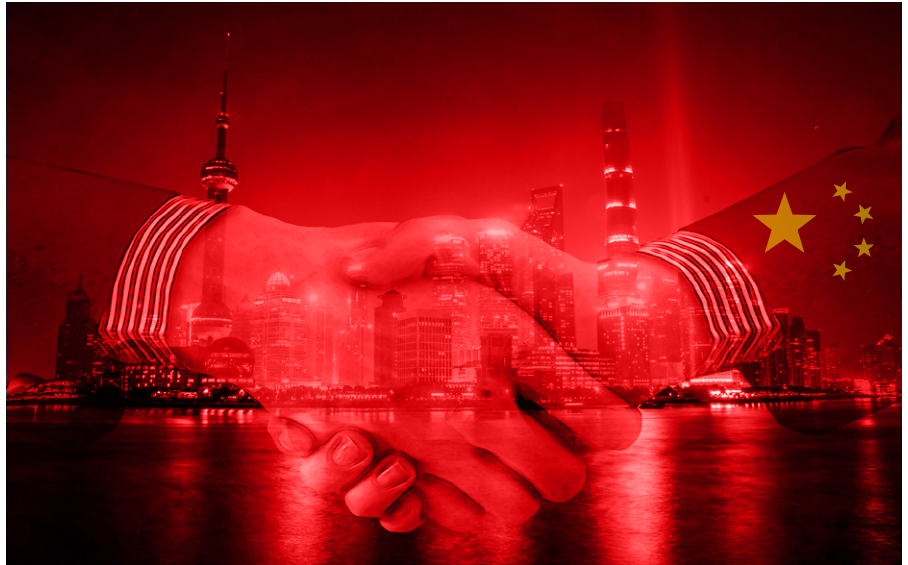
Symbolfoto. China reicht seine Hand zur Zusammenarbeit. Gemeinfrei

Dieser Text wurde zuerst am 20.10.2022 auf www.thecradle.co unter der URL https://thecradle.co/Article/columns/17132 veröffentlicht. Lizenz: © Pepe Escobar, The Cradle