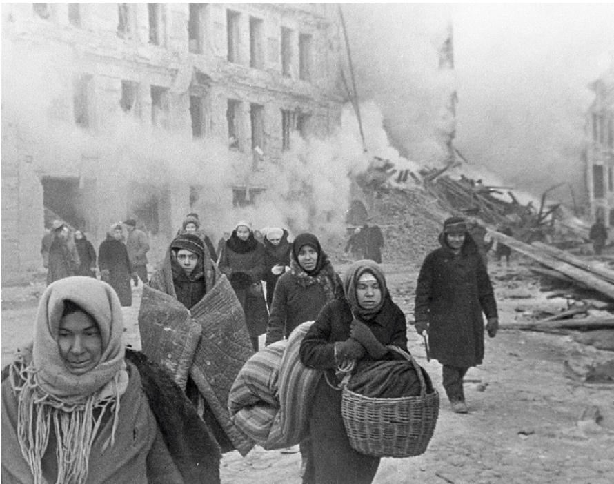
Sovjetiske civile forlader deres ødelagte huse efter et bombardement fra den tyske hær under kampen om Leningrad, 10.12.1942.

Den 22. juni, 1941, invaderede Wehrmacht Sovjetunionen med ca. 3.000.000