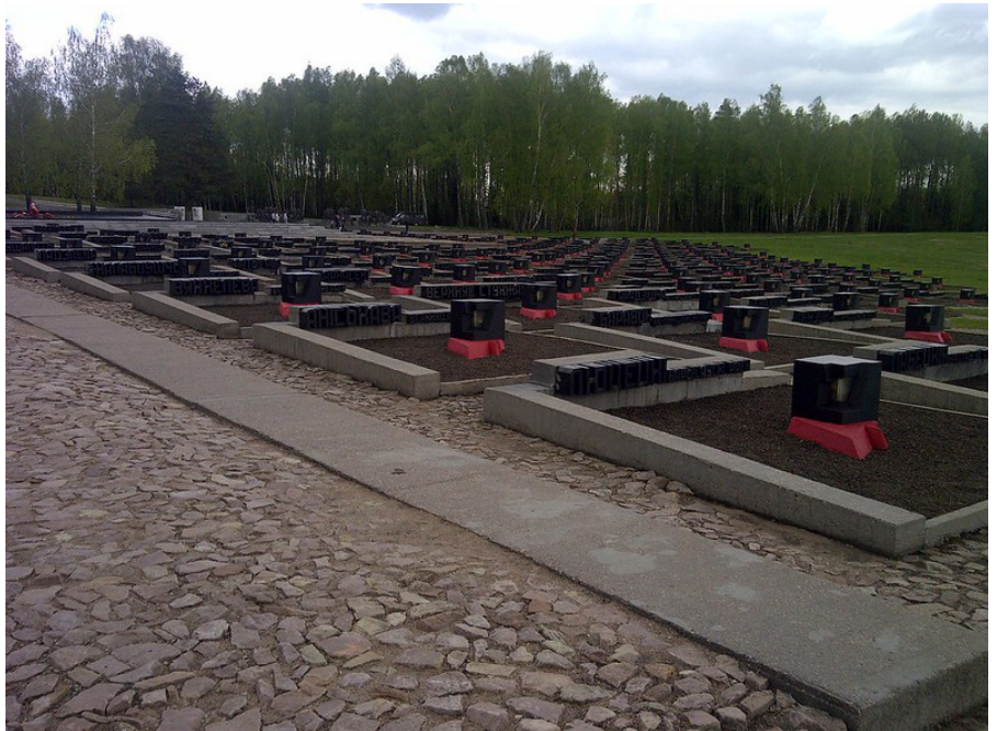
Kirkegård for landsbyer i mindesavmærket Khatyn: 186 grave, en for hver landsby.

Det systematiske masse mord på de europæiske jøder begyndte på Sovjetunionens territorie. I begyndelsen var der tale om isolerede og frygteligt brutale anti-jødiske pogromer, som blev udført af lokalbefolkningerne, især i Litauen, Letland og den vestlige del af Ukraine. Mens disse begivenheder, som SS beskrev som „selvrensingspraksis“, udspillede sig, så Wehrmachts besættelsesstyrker, selv om de var juridisk ansvarlige, passivt til. Pogromerne blev snart efterfulgt af systematiske henrettelser udført af sikkerhedspolitiet og specialstyrker. Selv om henrettelserne i begyndelsen var begrænset til jødiske mænd, der var kvalificerede til at gøre militærtjeneste, blev hele jødiske samfund senest fra august 1941 udryddet. Hver hviderussisk eller ukrainsk by, uanset hvor lille den var, led tusindvis af ofre. Ifølge skøn myrdede de tyske besættelse mellem 2,5 og 2,6 millioner sovjetiske jøder. Meget ofte ydede Wehrmacht logistisk støtte. Det morderiske samarbejde mellem Wehrmacht, SS og de almindelige nazistiske politi-styrker fulgte et lignende mønster under kampen mod partisanerne. Mellem 1942 og 1943 blev især i Hviderusland hele regioner omdannet til „ørkenområder“. Tusindvis af landsbyer blev brændt ned, hundredvis af dem sammen med byernes befolk-