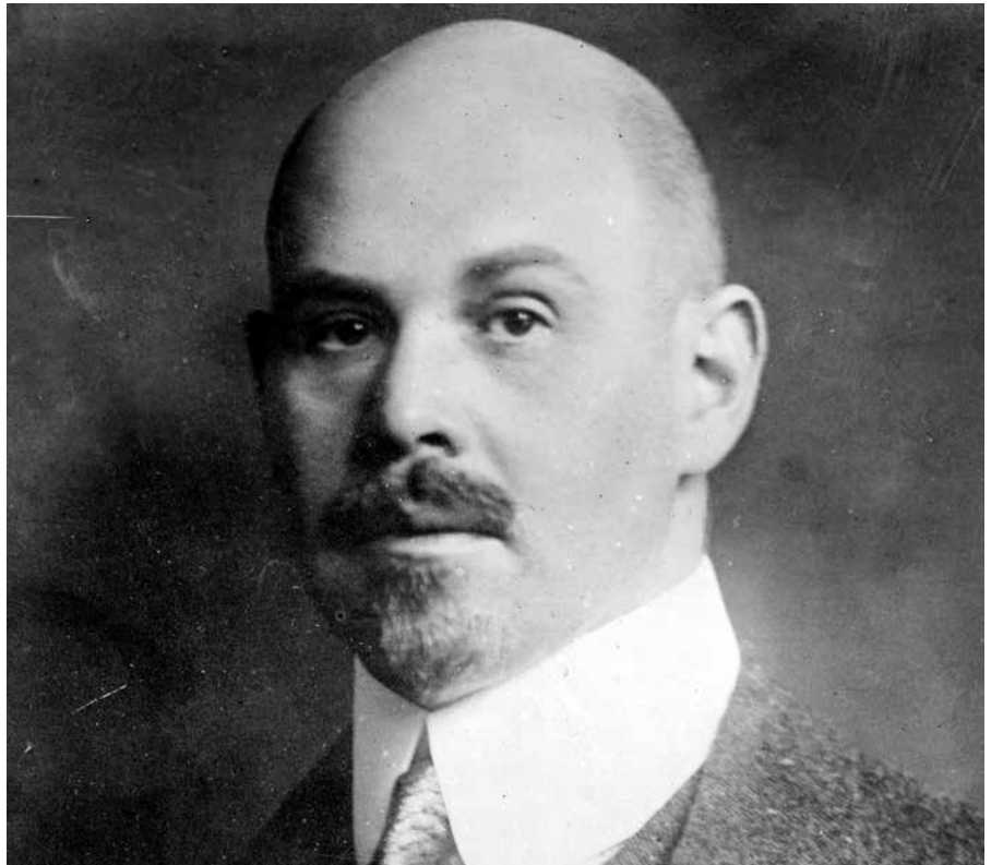
Walther Rathenau, deutscher Industrieller und Politiker, 1867-1922