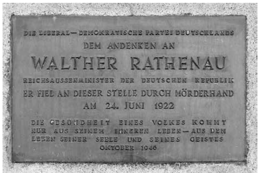
Gedenktafel, Walther Rathenau, Königsallee 16, Berlin-Grünwald, Deutschland am 19.05.2009

Auch am Samstag, dem 24. Juni 1922, muss Rathenau ein paar Stunden arbeiten. Er soll in den Räumen des Außenministeriums vormittags einer Prüfung von jungen Anwärtern für den diplomatischen Dienst beiwohnen. Die Nacht zuvor hat Rathenau wieder mal durchgemacht. Zuerst war er bei dem Botschaf-