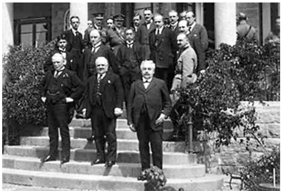
Die Konferenz von Genua 1922. Lloyd George in der ersten Reihe, links.

Und auch schon in der Eröffnungszeremonie, feierlich begleitet von katholischen Bischöfen, erwiesen sich die