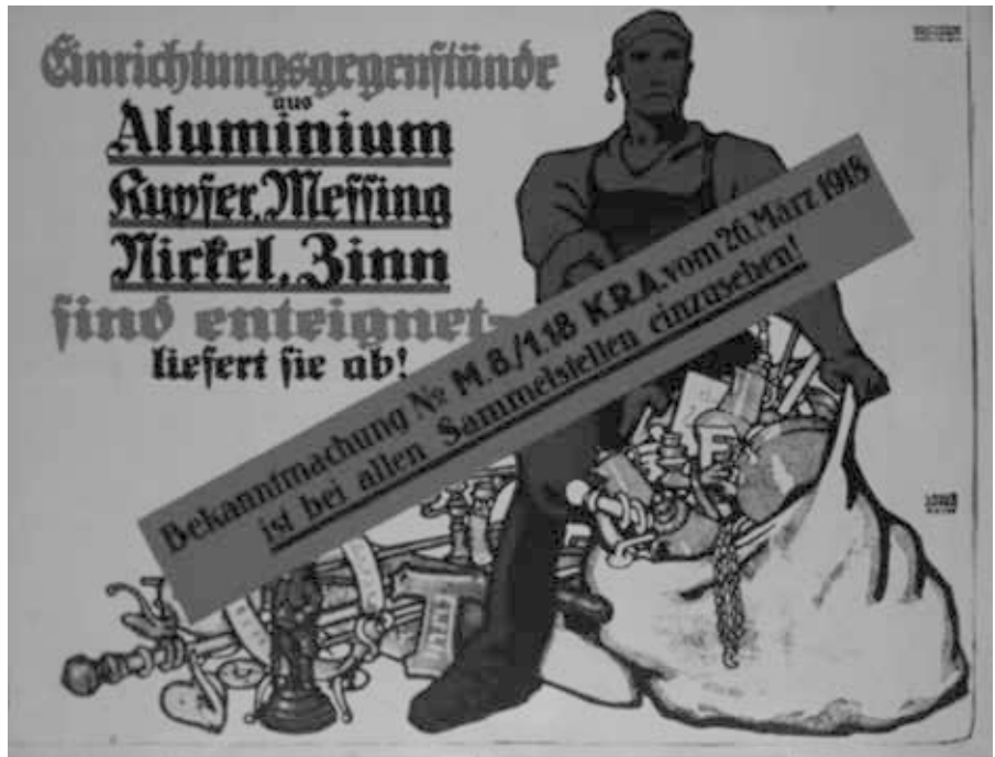
Bekanntmachung der Kriegsrohstoffabteilung, 1918 (Poster: Louis Oppenheimr)

Rathenau hatte die Kriegsrohstoffabteilung schon im Jahre 1915 wieder verlassen. Typisch Rathenau: Wenn er ein Unternehmen erfolgreich in die Welt gesetzt hat, das selbst weiter laufen kann, dann wendet sich der rührige Unternehmer dem nächsten Projekt zu. In diesem Falle wurde Rathenau nach dem Ableben seines Vaters Emil dringend an der Spit-