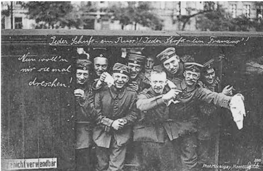
Wohlfahrts-Karte des Vaterländischen Frauenvereins, Provinzialvereins Berlin zum Besten der Kriegsfürsorge um 1914

von Salpeter und natürlichem Ammoniak durch die Seeblockade absperren. In nicht allzu ferner Zukunft müsste dann Deutschland kapitulieren. Ganz einfach, weil den Streitkräften die Munition ausgegangen ist! Man sieht, unsäglich blöde Politiker und Militärs hat es auch früher schon gegeben. Rathenau sucht den Oberbefehlshaber der kaiserlichen Streitkräfte umgehend auf und überreicht ihm sein Memorandum [5].