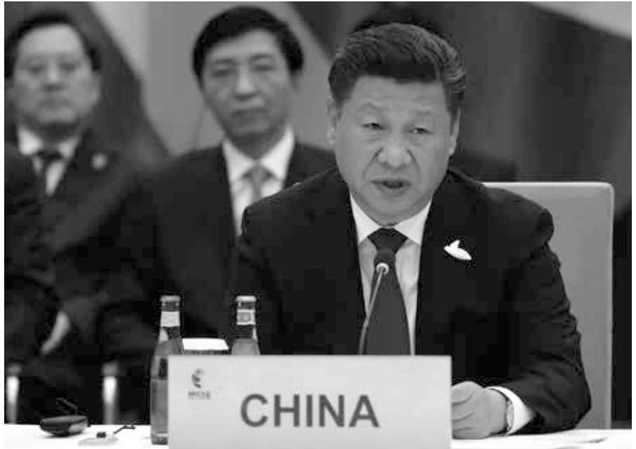
Präsident Xi Jinping der Volksrepublik China beim informellen Treffen der BRICS-Staats- und Regierungschefs vor Beginn des G20-Gipfels in Hamburg am 07.07.2017