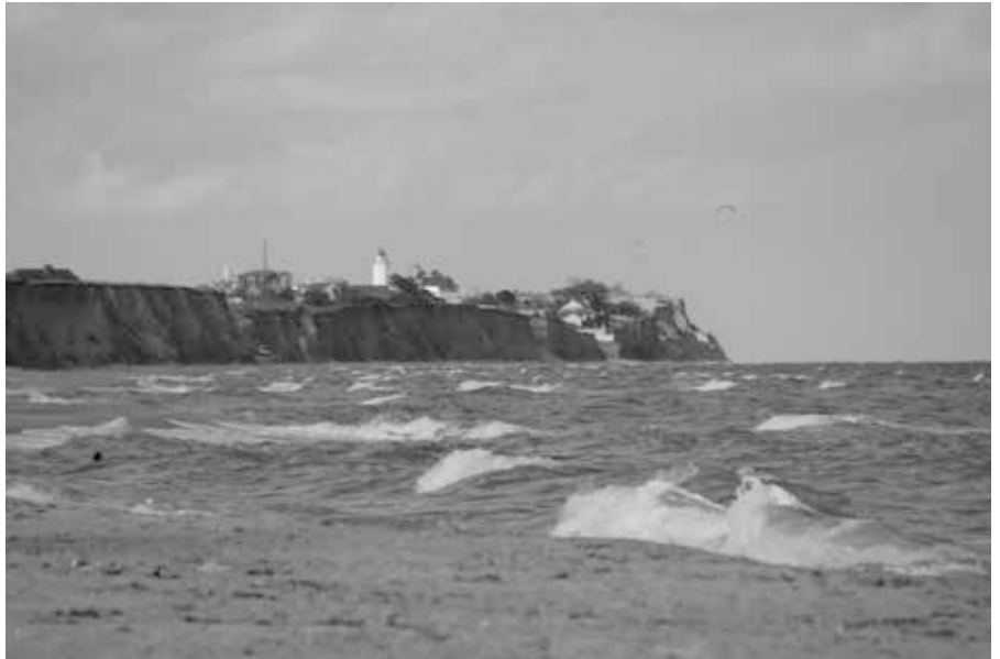
Die Schwarzmeerküste bei Tschornomorsk südlich von Odessa am 27.9.2014.