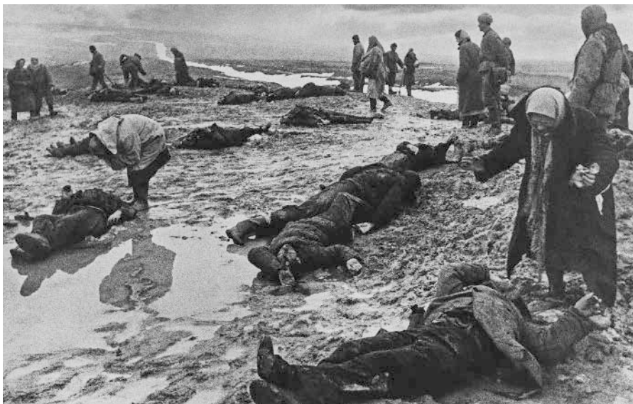
Russiske mødre fjerner ligene fra slagmarken efter slaget ved Kerch, i 1942.

Denne tekst blev første gang offentliggjort på www.nachdenkseiten.de under følgende URL https://www.nachdenkseiten.de/?p=84845 den 15.6.2022. Licens: Leo Ensel, NachDenkSeiten, CC BY-NC-ND 4.0