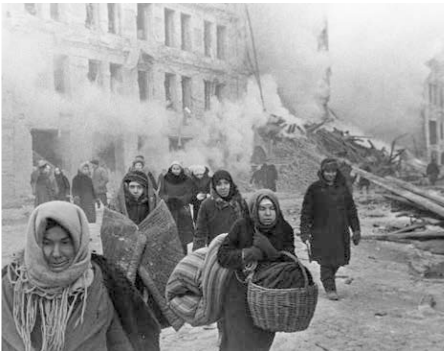
Sovjetiske civile forlader deres ødelagte huse efter et bombardement fra den tyske hær under kampen om Leningrad, 10.12.1942.

Den 22. juni, 1941, invaderede Wehrmacht Sovjetunionen med ca. 3.000.000