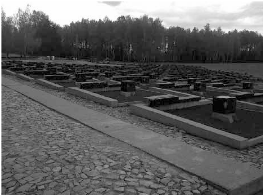
Kirkegård for landsbyer i mindesavmærket Khatyn: 186 grave, en for hver landsby.

Det systematiske masse mord på de europæiske jøder begyndte på Sovjetunionens territorie. I begyndelsen var der tale om isolerede og frygteligt brutale anti-jødiske pogromer, som blev udført af lokalbefolkningerne, især i Litauen, Letland og den vestlige del af Ukraine. Mens disse begivenheder, som SS beskrev som „selvrensningspraksis“, udspillede sig, så Wehrmachts besættelsesstyrker, selv om de var juridisk ansvarlige, passivt til. Pogromerne blev snart efterfulgt af systematiske henrettelser udført af sikkerhedspolitiet og specialstyrker. Selv om henrettelserne i begyndelsen var begrænset til jødiske mænd, der var kvalificerede til at gøre militærtjeneste, blev hele jødiske samfund senest fra august 1941 udryddet. Hver hviderussisk eller ukrainsk by, uanset hvor lille den var, led tusindvis af ofre. Ifølge skøn myrdede de tyske besættelse mellem 2,5 og 2,6 millioner sovjetiske jøder. Meget ofte ydede Wehrmacht logistisk støtte. Det morderiske samarbejde mellem Wehrmacht, SS og de almindelige nazistiske politi-styrker fulgte et lignende mønster under kampen mod partisanerne. Mellem 1942 og 1943 blev især i Hviderusland hele regioner omdannet til „ørkenområder“. Tusindvis af landsbyer blev brændt ned, hundredvis af dem sammen med byernes befolk-