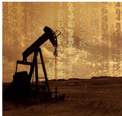
Der Ölpreis wird für die Durchsetzung von Sanktionen verwendet.

Die konzertierte Aktion, die größte, die jemals für die Freigabe strategischer Reserven in mehreren Ländern durchgeführt wurde, soll Schwankungen bei Angebot und Nachfrage nach Öl ausgleichen, sagten Beamte der Regierung. Und es war ein Schuss vor den Bug der OPEC+, der Bezeichnung für die Organisation der erdölexportierenden Länder, sowie für Russland und andere Länder (OPEC+ ist keine internationale Organisation, sondern eine Plattform für die Kooperation