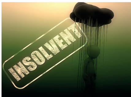
Hohe Energiepreise führen zu einer massiven Deindustrialisierung Europas.

Die westlichen Mächte sind viel zu naiv, wenn sie glauben, dass eine Energie-Supermacht wie Russland einfach aus dem Ökosystem ‚gelöscht‘ werden kann. In einem ‚Energiekrieg‘ mit Russland sind sie dazu verdammt, als Verlierer dazustehen.