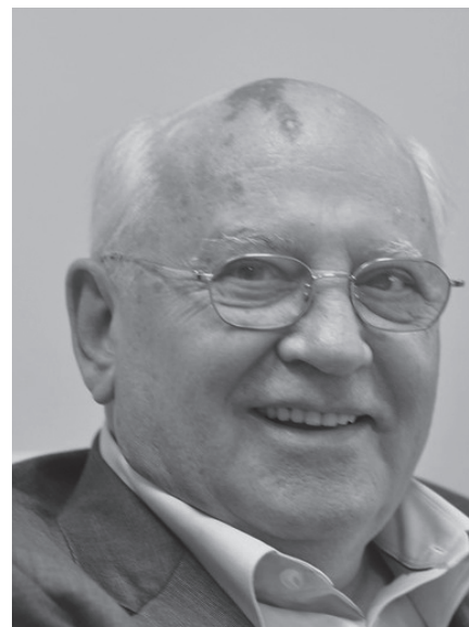
Michail Sergejewitsch Gorbatschow. Bild aufgenommen am 12.05.2012.