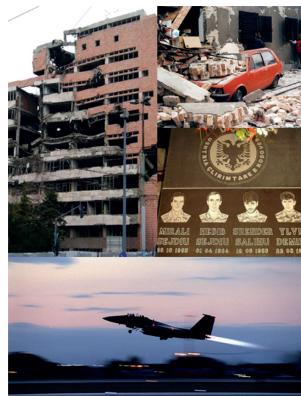
Titelbild für den Kosovo-Krieg (Kollage: Unbekannt, Adobe Photoshop, erstellt am 15. Oktober 2007, Wikimedia Commons, CC BY-SA 2.5)

Für Angriffskriege reicht seitdem eine gefühlte Bedrohung aus – wie beim Bethlehemer Kindermord.