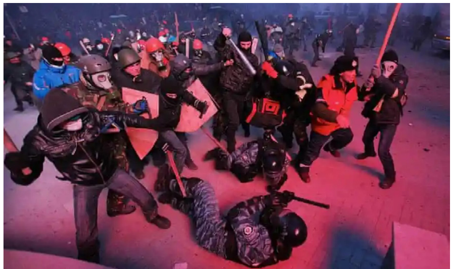
Demonstranten auf dem Maidan greifen die Polizei an, 2014

Die extreme Rechte war nicht mit der gleichen Art von Unterdrückung konfrontiert. Obwohl sowohl Krawtschuk als auch Kutschma das Land ausplünderten [9], nachdem sie ein Massenprivatisierungsprogramm im Stile Jelzins [10] in Kraft gesetzt hatten, genossen sie breite Unterstützung in der extremen Rechten. Erst als Leonid Kutschma auf Band dabei erwischt wurde, wie er den Mord an Georgij Gongadse anordnete, einem ehemaligen Rechtsterroristen und Gründer der Ukrayinska Pravda [11], brach der Damm und die Rechten wandten sich gegen den Staat.