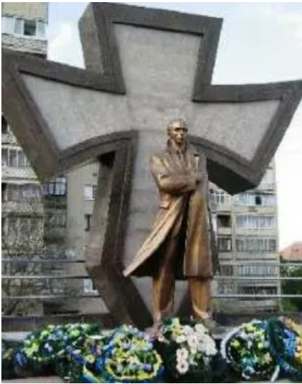
Denkmal für Stepan Bandera in Iwano-Frankiwsk

Nach seinem Sieg leitete Juschtschenko eine umfassende Rehabilitierung der Nazi-Kollaborateure der OUN ein, die aktiv am Holocaust beteiligt gewesen waren. Straßen und Städte wurden umbenannt, im ganzen Land wurden Denkmäler [16] für die faschistischen Mörder errichtet. Zudem zeichnete Juschtschenko die berüchtigten OUN-Kommandeure Stepan Bandera und sogar Roman Schuchewytsch [17], der einst 8.000 Polen an einem einzigen Tag ermordete, als Helden der Ukraine aus - unter breiter Verurteilung [18] im In- und Ausland.