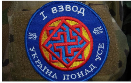
Abzeichen des Ersten Zuges des Donbass-Bataillons.

[34] The Guardian, Ewen MacAskill, „Ukraine crisis: bugged call reveals conspiracy theory about Kiev snipers“, am 5.3.2014, < https://www.theguardian.com/world/2014/mar/05/ukraine-bugged-call-catherine-ashton-urmas-paet >