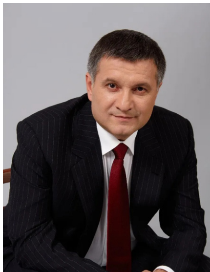
Arsen Awakow

Er stand vor einer schier unlösbaren Aufgabe. Das neue Kiewer Regime fiel auseinander, demokratisch gewählte Abgeordnete in Charkiw und anderswo erklärten ihre Unabhängigkeit [43]. Awakow begann mit der Verlegung