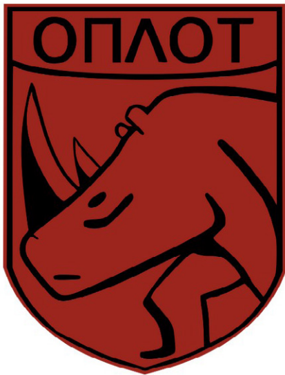
Abzeichen der 5. separaten motorisierten Gewehrbrigade „OPLoT“.

Als Reaktion darauf bildeten sich im Osten verschiedene Milizen, Selbstverteidigungseinheiten und paramilitärische Einheiten. Anfangs waren die Milizen oft alles, was zwischen den Menschen im Donbass und den Äxten, Hämmern und Molotow-Cocktails der Mörder des Maidan-Regimes stand.