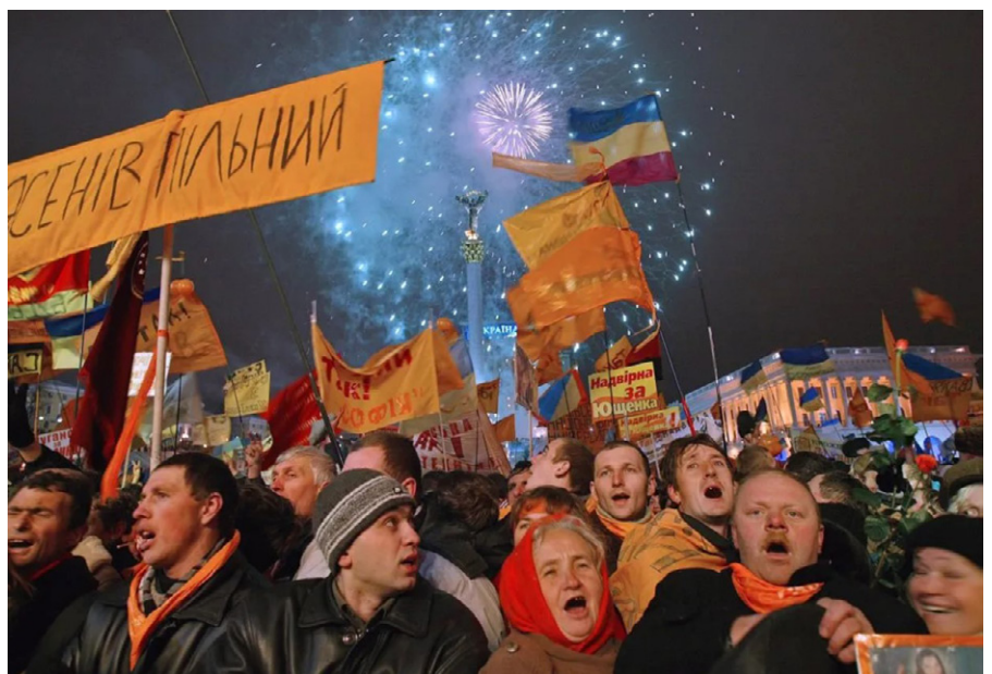
Demonstranten der Orangenen Revolution im Jahr 2004.

Viktor Janukowitsch und seine „Partei der Regionen“ hingegen nutzten das Chaos und die Inkompetenz der Juschtschenko-Regierung und gingen aus den Wahlen, die von internationalen Beobachtern als frei [22] und fair [23] eingestuft wurden, als Sieger hervor.