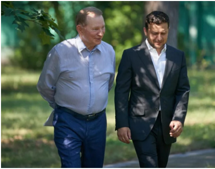
Leonid Kutschma mit Wolodymyr Zelenski, 2020.

Die Gruppe, der Gongadse angehörte, die UNA-UNSO (Abkürzung für: Ukrainische Nationalversammlung – Ukrainische Nationale Selbstverteidigung; Anm. d. Red.) [12], wurde von Jurij Schuchewytsch gegründet, dem Sohn des berüchtigten Völkermörders Roman Schuchewytsch. Sie war später zusammen mit Slava Stetskos KUN Gründungsmitglied der berüchtigten neofaschistischen Allianz Rechter Sektor [13].