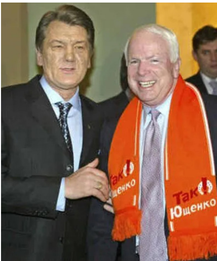
John McCain and Viktor Yuschtschenko

Während das Drama in der Rada sich fortsetzte, blieb die Ukraine arm, korrupt und tief gespalten. Janukowitsch machte Zugeständnisse an die Nationalisten und strebte eine Annäherung an die EU an. 2014 forderte der IWF die Ukraine auf,