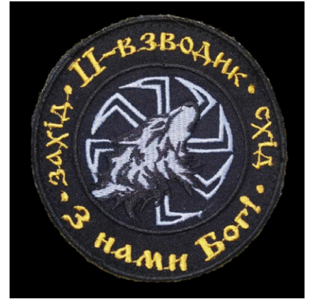
Abzeichen des zweiten Zuges des Donbass-Bataillons.

Am 15. April 2015 gründete Awakow die Polizei für Sonderaufgaben (Special