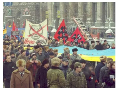
Proteste „Ukraine ohne Kutschma“ vom 6. Februar 2001.

Was Juschtschenkos Politik betrifft, so wurde er von den Vereinigten Staaten großzügig finanziert [15] und befürwortete einen schnellstmöglichen Beitritt zur NATO. Unter dem Deckmantel der neoliberalen Seriosität war Juschtschenko auch ein überzeugter Nationalist.