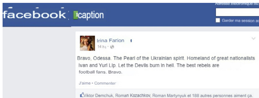
Die Rada-Abgeordnete Iryna Farion applaudiert dem Massaker von Odessa.

Während die staatlichen Strukturen zusammenbrachen, wurde der Polizeischutz immer unzuverlässiger. Ohne Bezahlung und ohne klare Führung löste sich ein Großteil der ukrainischen Polizei einfach auf, da sie nicht bereit war, ihr Leben für eine Regierung zu riskieren, die nicht mehr existierte. Der Rest war gezwungen, sich für eine Seite zu entscheiden. Einige schlossen sich Kiew an, andere blieben in ihren Gemeinden. Diejenigen, die blieben, wurden schnell überwältigt, als die Maidan-Kräfte den Übergang vom Werwolf [35] zur Wehrmacht vollzogen.