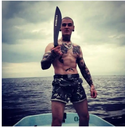
Danyial al-Takbir, Rufzeichen „Mujahid“

Ich bin mehrmals in eine Situation geraten, in der man dem Militär Hilfe leistet und zu Gott betet, damit man den Ort lebend und gesund verlassen kann. Es stellte sich heraus, dass ich nur deshalb in Ruhe gelassen wurde, weil nach einigen ‚Diebesgesetzen‘ die Hand des Gebers nicht abgeschnitten wird. Soll ich Ihnen erzählen, wie ein Dutzend Soldaten ein junges Mädchen entführt und 10 Tage lang vergewaltigt haben, bevor das Kind starb? Soll ich Ihnen erzählen, wie bewaffnete Leute in die Einrichtungen von Mariupol kamen und den Eigentümern eine Waffe an den Kopf hielten und sie zwingen, sie zu ernähren? Und dann feierten sie dort einen Monat lang jeden Tag ihre Partys. Wie sie jedes vorbeifahrende Auto auf der Straße anhielten und einen Tribut von den Leuten forderten. Wie sie sich an Raubzügen beteiligten? Wie sie Menschen in Kellern festhielten, sie schlugen und Geld forderten? Die hässliche Wahrheit? Scheußlich, nicht wahr? Aber es war so!“