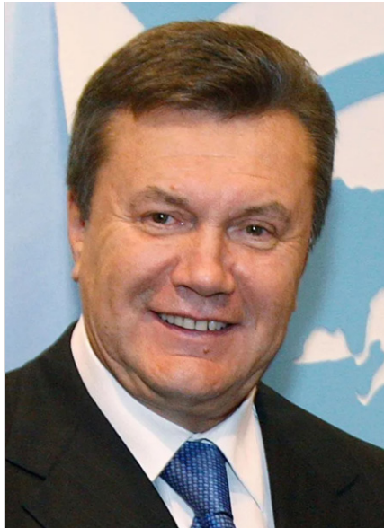
Viktor Yanukowitsch, 2010.

Janukowitschs wichtigster Herausforderer war Viktor Juschtschenko, ein Bankverwalter, der zum Premierminister wurde und zum Führer und öffentlichen Gesicht der Anti-Kutschma-Bewegung geworden war. Kutschma war so unbeliebt, dass Juschtschenko eine breite Koalitionspartei mit dem Namen „Unsere Ukraine“ [14] aufbauen konnte, die 2002 schließlich die Mehrheit der Stim-