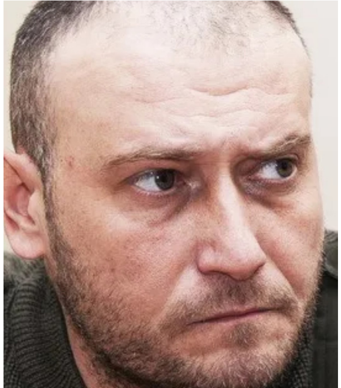
Dmytro Yarosh

„Ich frage mich, wie es dazu kommen konnte, dass die meisten Milliardäre in der Ukraine Juden sind“ - Dmytro Jarosch [1], ehemaliger Volksabgeordneter der Ukraine. Teil 3 einer Serie über den ukrainischen Faschismus. Siehe Teil 1 [2] und Teil 2 [3].