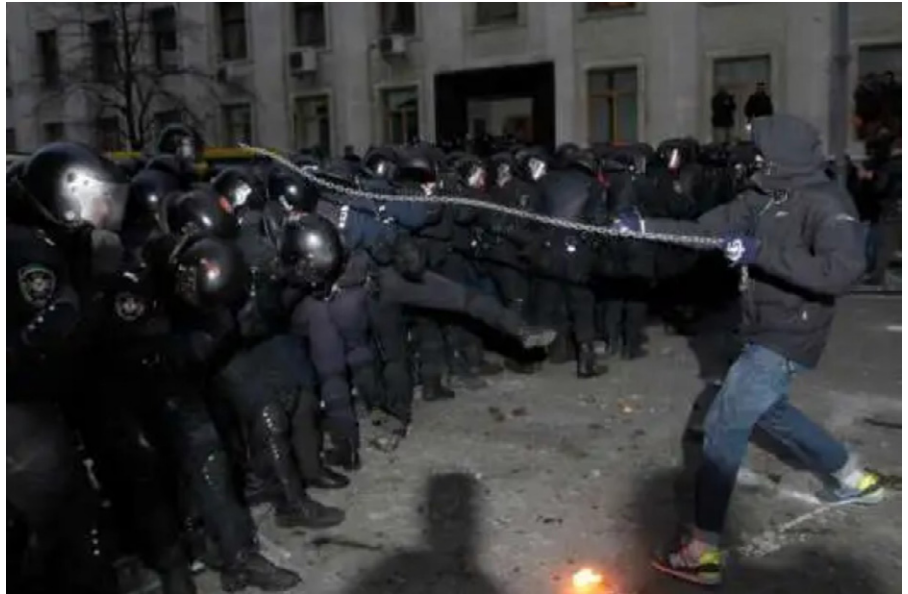
Schwarzer Komitee-Kämpfer greift Polizei an, 1. Dezember 2013.

die Steuern auf lebenswichtige Güter und Dienstleistungen drastisch zu erhöhen, die Löhne einzufrieren und die sozialen Sicherheitsnetze zu beschneiden. Die Regierung lehnte diese Forderungen ab, da sie davon ausging, dass sie zum Verlust von Hunderttausenden [26] von Arbeitsplätzen führen könnten.