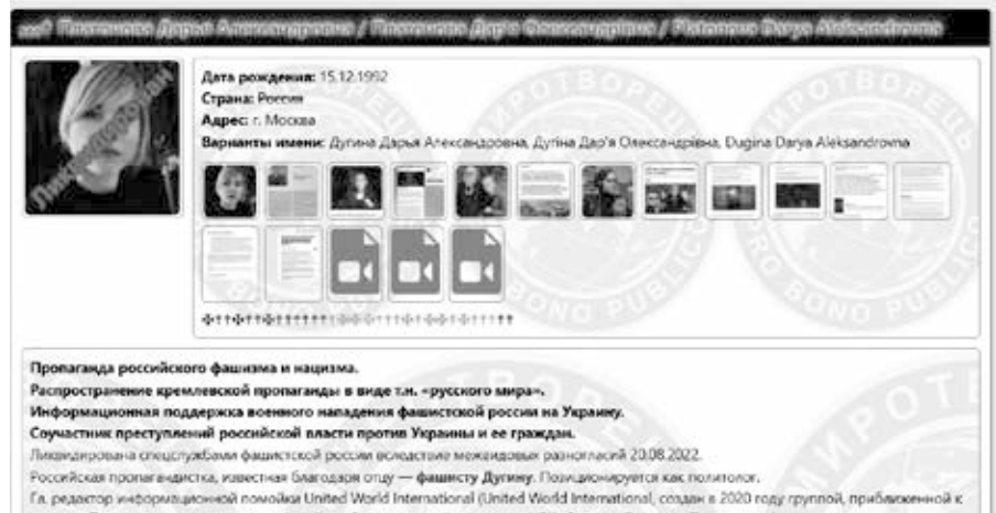
Die russische Journalistin Darya Dugina, 29, die ebenfalls auf der Abschussliste von Myrotvorets stand, wurde am 23. August bei einem Autobombenanschlag in Moskau getötet. Screenshot der Webseite Myrotvorets.

Ritter sagt weiter, dass er Debatten und Meinungsverschiedenheiten über seine