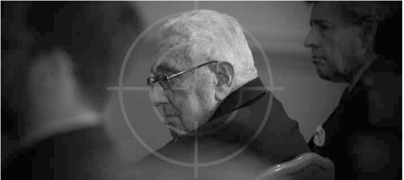
Henry Kissinger steht auf Grund seiner Aussagen zum Russland-Ukraine-Krieg auf einer Webseite, die als „Attentatsliste“ dient. Symbolfoto, gemeinfrei.