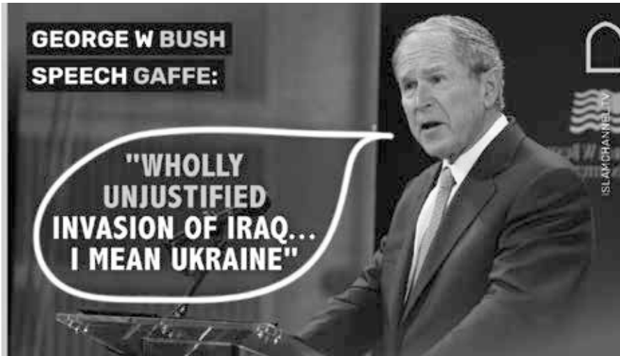
Freudscher Versprecher bei dem ehemaligen US-Präsidenten George W. Bush?

Janeiro, dass das Attentat am 1. September 2022 auf die argentinische Vizepräsidentin Cristina Fernández de Kirchner möglicherweise sogar auf ihre Weigerung zurückzuführen ist, Russlands militärische Sonderoperation zu verurteilen, sowie auf ihre Forderung nach Friedensgesprächen zur Beendigung des Krieges.