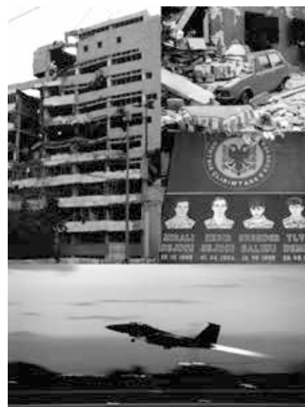
Titelbild für den Kosovo-Krieg

Für Angriffskriege reicht seitdem eine gefühlte Bedrohung aus – wie beim Bethlehemer Kindermord.