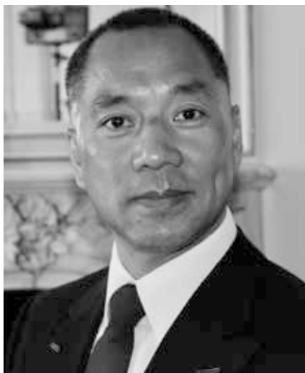
Guo Wengui

GTV und seine medialen Ableger wie GNews und Voice of Guo präsentieren ihre Projekte [8] zwar auf aalglatte Art und Weise, aber sie haben alle den Bei-