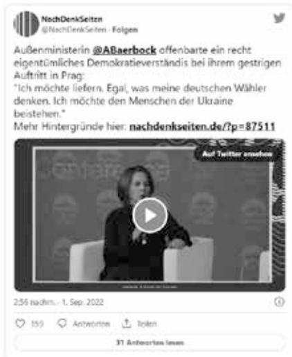
Twitterkanal Nachdenkseiten zur Aussage von Außenministerin Annalena Baerbock am 01. September 2022.

Bei der Verteidigung der amtierenden Außenministerin und Grünen-Spitzenpolitikerin wollten die Tagesschau-Kollegen im Hugh-Greene-Weg 1 nicht zurückstehen und aktivierten gleich den hauseigenen „Faktenfinder“, der auch umgehend zum Fazit [2] kam, dass es sich um eine „gezielte pro-russische Desinformationskampagne“ handle.