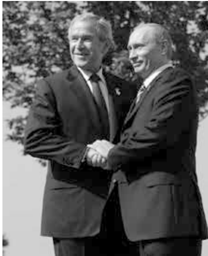
George W. Bush und Wladimir Putin

Chinas Reaktion auf den 11. September 2001 wurde noch komplizierter, als der Krieg in Afghanistan immer komplizierter wurde. China begann, eine anhaltende US-Militärpräsenz in seiner Nachbarschaft fast ebenso sehr zu fürchten, wie die terroristische Bedrohung durch die Taliban