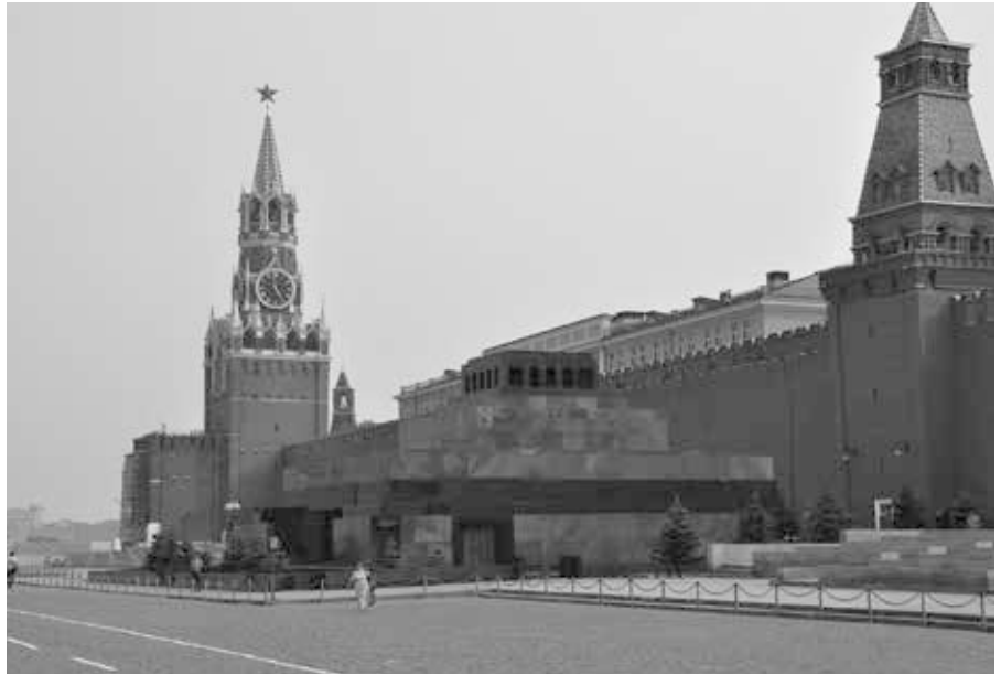
Kreml Moskau, Roter Platz am 08.08.2010