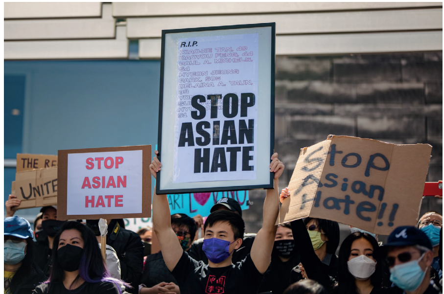
Protest gegen Rassismus gegen Asiaten, San Jose, USA

Ich habe einen traurigen Fall erlebt, in dem ein Barbesitzer, der sich mutig gegen die staatliche „Impf“-Vorschrift für seine Kunden aussprach, verspottet und lächerlich gemacht wurde, weil er selbst sich an die strenge Vorschrift hielt, obwohl die Nichteinhaltung den Verlust seines Geschäfts hätte bedeuten können. Diese Art von Atmosphäre verhindert effizient konstruktive Gemeinschaftsaktionen. Sie verhindert das natürliche Wachstum echter sozialer Beziehungen zwischen den