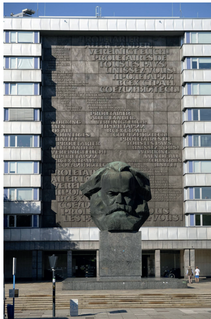
Das Wesen des Kapitalismus ist von Karl Marx beschrieben worden. Denkmal in Chemnitz, früher Karl-Marx-Stadt

Wenn wir von den Kapitalisten geprügelt werden, werden wir gegeneinander ausgespielt. Wenn wir uns wehren, sind wir gezwungen, unsere Mitmenschen anzugreifen, da unsere Institutionen weiter kolonisiert werden, wie ich oben beschrieben habe. Im politischen Theater der Konzerne werden Milliarden von Dollar ausgegeben, um zwischen dem hartgesottenen Korporatisten Joe Biden und dem „Reality-TV-Star“ Donald Trump zu wählen. Aber wir können die politische Institution, die wirklich als unsere eigene funktionieren kann, nicht annehmen – eine solch drastische Veränderung wird wieder einmal als „Sozi-