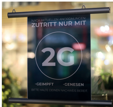
Rassenfragen und Covid-„Impfstoffe“: Die Hälfte der schwarzen Bevölkerung New Yorks hat sich gegen die Impfung entschieden. Wie kann jemand rechtfertigen, die Hälfte der Schwarzen von Aktivitäten in geschlossenen Räumen auszuschließen?

Und dieselben Leute, denen alles gehört, sagen uns, dass wir die Gewaltenteilung respektieren müssen, dass wir uns auf die „repräsentative Demokratie“ verlassen und dass wir dem Rechtssystem gehorchen müssen, das letztlich von Richtern des Obersten Gerichtshofs bestimmt wird, die von, tja, denselben Leuten ernannt werden, denen alles gehört.