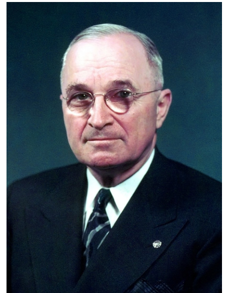
33. US-Präsident Harry S. Truman von 1945 bis 1953

Im Falle der Türkei diente die Truman-Doktrin als Instrument zur Beeinflussung der türkischen Außenpolitik und zur Bindung des Landes an westliche Staaten. Nur wenige Kritiker innerhalb der USA