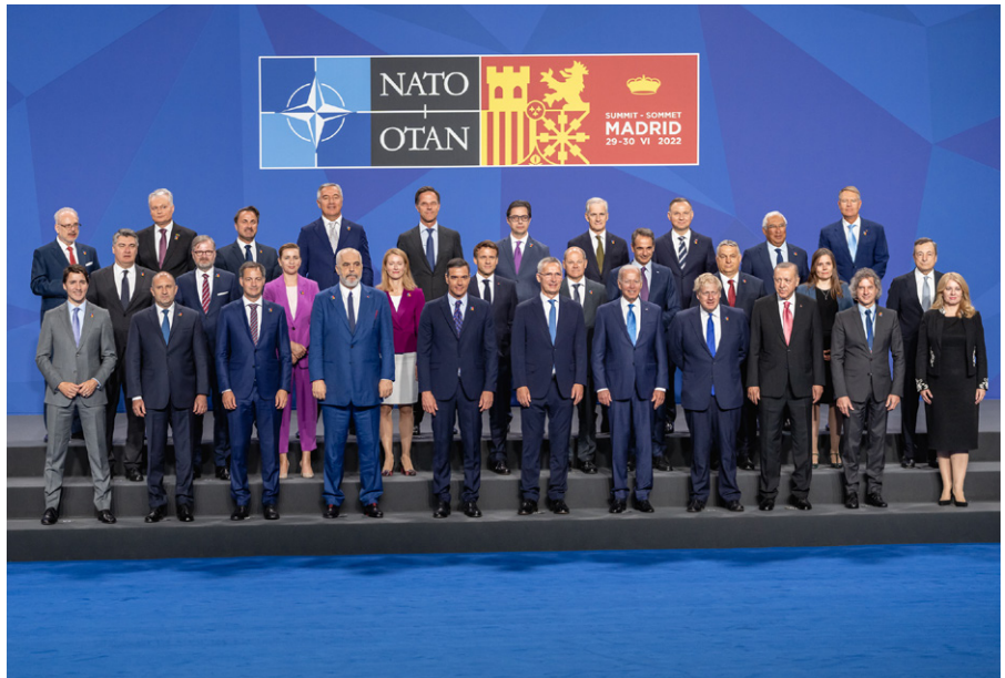
Die Führer der NATO-Mitglieder bei einem gemeinsamen Foto während des Madrider NATO-Gipfels 2022; gemeinfrei

Dieser Text wurde zuerst am 04.07.2022 auf www.commondreams.org unter der URL https://www.commondreams.org/views/2022/07/04/natos-expansion-and-new-strategic-concept-broaden-prospect-armageddon veröffentlicht. Lizenz: C.J. Polychroniou/Common Dreams, CC BY-NC-ND 3.0