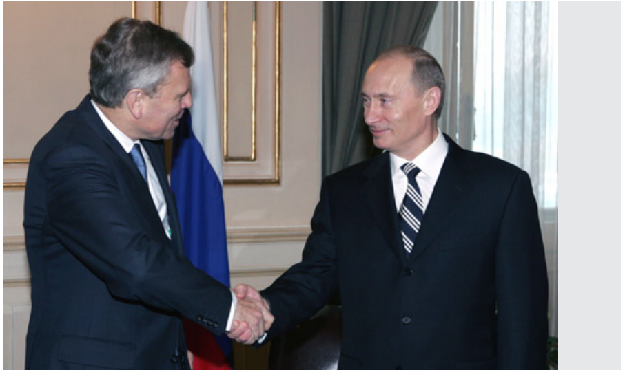
Wladimir Putin mit NATO-Generalsekretär al Jaap de Hoop Scheffer im Rahmen des Nato-Gipfels 2008 in Bukarest. Quelle: Presse- und Informationsamt des Präsidenten Russlands; Lizenz: CC BY-NC-ND 3.0

Das letzte Land, das der Nato vor dem Zusammenbruch der Sowjetunion beitrug, war Spanien im Jahr 1982. Die Struktur der Nato entwickelte sich im Laufe des Kalten Krieges weiter, ebenso wie ihr Ansatz in Bezug auf Verteidigung und Abschreckung, wiewohl Kernwaf-