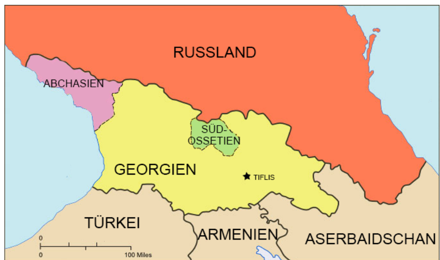
Russland, Georgien, Südossetien.

Mit der Verabschiedung des neuen strategischen Konzepts werden die USA ihre militärische Präsenz (mit mehr Truppen, Kampfflugzeugen und Schiffen) auf eu-