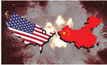
USA und China prallen aufeinander. Symbolbild. Gemeinfrei.

Erstens sind die Volkswirtschaften Chinas und der Vereinigten Staaten eng miteinander verflochten. China aus der globalen Versorgungskette und den Schlüsselindustrien auszuschließen, ist für die Vereinigten Staaten zum gegenwärtigen Zeitpunkt eine nahezu unmögliche Aufgabe. Chi-