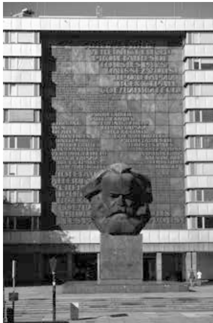
Das Wesen des Kapitalismus ist von Karl Marx beschrieben worden. Denkmal in Chemnitz, früher Karl-Marx-Stadt

Wenn wir von den Kapitalisten geprüft werden, werden wir gegeneinander ausgespielt. Wenn wir uns wehren, sind wir gezwungen, unsere Mitmenschen anzugreifen, da unsere Institutionen weiter kolonisiert werden, wie ich oben beschrieben habe. Im politischen Theater der Konzerne werden Milliarden von Dollar ausgegeben, um zwischen dem hartgesottenen Korporatisten Joe Biden und dem „Reality-TV-Star“ Donald Trump zu wählen. Aber wir können die politische Institution, die wirklich als unsere eigene funktionieren kann, nicht annehmen – eine solch drastische Veränderung wird wieder einmal als „Sozi-