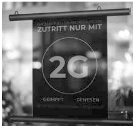
Rassenfragen und Covid-„Impfstoffe“: Die Hälfte der schwarzen Bevölkerung New Yorks hat sich gegen die Impfung entschieden. Wie kann jemand rechtfertigen, die Hälfte der Schwarzen von Aktivitäten in geschlossenen Räumen auszuschließen?

Und dieselben Leute, denen alles gehört, sagen uns, dass wir die Gewaltenteilung respektieren müssen, dass wir uns auf die „repräsentative Demokratie“ verlassen und dass wir dem Rechtssystem gehorchen müssen, das letztlich von Richtern des Obersten Gerichtshofs bestimmt wird, die von, tja, denselben Leuten ernannt werden, denen alles gehört.