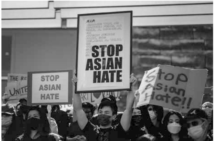
Protest gegen Rassismus gegen Asiaten, San Jose, USA

Ich habe einen traurigen Fall erlebt, in dem ein Barbesitzer, der sich mutig gegen die staatliche „Impf“-Vorschrift für seine Kunden aussprach, verspottet und lächerlich gemacht wurde, weil er selbst sich an die strenge Vorschrift hielt, obwohl die Nichteinhaltung den Verlust seines Geschäfts hätte bedeuten können. Diese Art von Atmosphäre verhindert effizient konstruktive Gemeinschaftsaktionen. Sie verhindert das natürliche Wachstum echter sozialer Beziehungen zwischen den