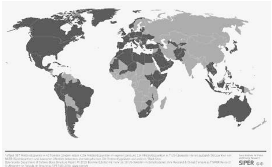
US-Militärstützpunkte weltweit, Stand 2017; Quelle: Alexandre de Robaulx de Beurieux, SIPER.ch

Millionen von Menschen sind umgekommen. Einer von hundert Menschen wurde zum Flüchtling. Länder wurden zerstört. Die Dynamik des Krieges gegen den Terror hat den institutionalisierten Rassismus und die strukturelle Gewalt auch innerhalb der USA verschärft und