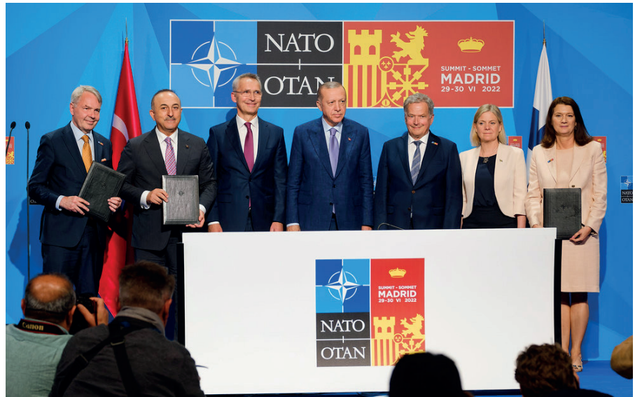
Türkei, Finnland und Schweden unterzeichnen ein Abkommen zur finnischen und schwedischen NATO-Mitgliedschaft. Von links nach rechts: Pekka Haavisto Außenminister von Finnland, Mevlüt Çavuşoğlu Außenminister der Türkei, NATO Generalsekretär Jens Stoltenberg, Recep Tayyip Erdoğan Präsident der Türkei, Sauli Niinistö Präsident von Finnland und Magdalena Andersson Premierministerin Schwedens und Ann Linde Außenministerin von Schweden.

Dieser Text wurde zuerst am 06.07.2022 auf www.infosperber.ch unter der URL < https://www.infosperber.ch/politik/ein-schrecklicher-preis-fuer-die-nato-erweiterung > veröffentlicht. Lizenz: © Amalia van Gent, Infosperber.ch