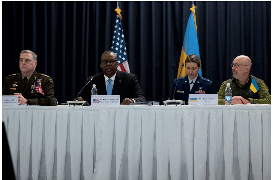
US Verteidigungsminister Lloyd J. Austin III spricht auf dem Treffen der Ukraine Defense Consultative Group auf dem Luftwaffenstützpunkt Ramstein, Deutschland, am 26. April 2022.