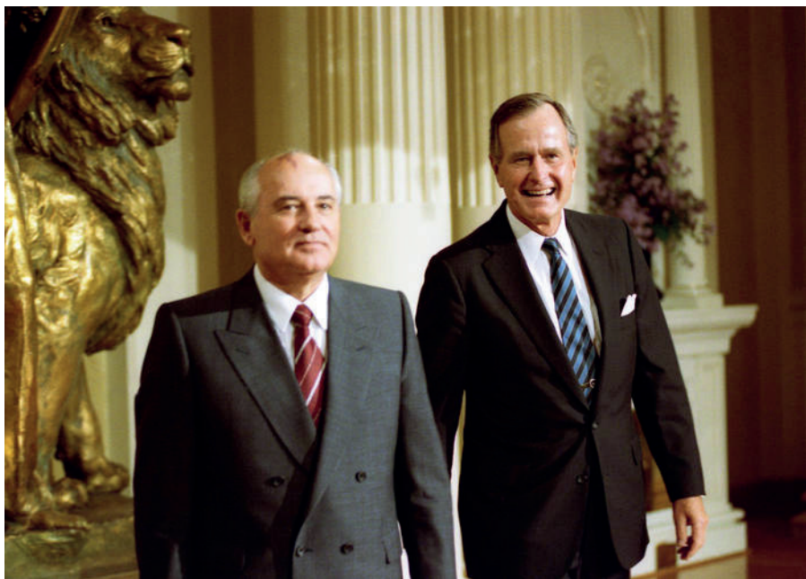
Die Präsidenten George H. W. Bush und Michail Gorbatschow posieren für ein offizielles Porträt während ihres Treffens in Helsinki, Finnland, am 9. September 1990

Jedes Mal, wenn so etwas passiert, beginnen die westlichen Medien und Apologeten ihre Geschichte damit, dass Putin dies oder jenes aus heiterem Himmel getan habe, ohne dass in der Vergangenheit etwas vorgefallen wäre. So wird der