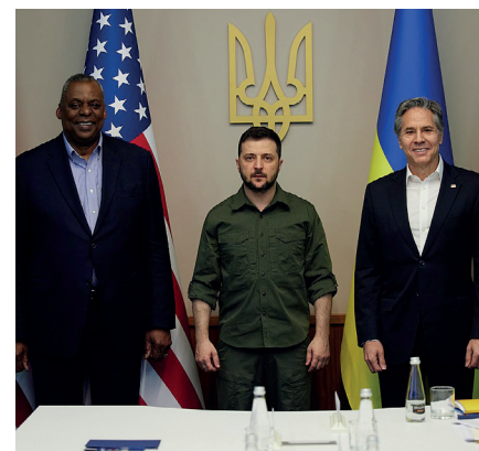
Treffen des Präsidenten der Ukraine, Wolodymyr Selenskyj, mit dem US-Außenminister, Antony Blinken, und dem US-Verteidigungsminister, Lloyd Austin, am 24. April 2022 in Kiew.

Schauen wir uns den Hintergrund all dessen an. Bisher waren die gemeinsamen Militärausgaben der NATO etwa 12-mal höher als die Russlands - mit steigender Tendenz. In den Tagen des ersten Kalten Krieges beliefen sich die Militärausgaben des Warschauer Paktes auf etwa 70-75 % der NATO-Ausgaben. Damals - vor 30 bis 40 Jahren - war man sich auf beiden Seiten einig, dass ein Gleichgewicht - das in Bezug auf Waffen, Ausgaben, Feuerkraft, technologische Qualität usw. nur schwer zu messen ist - das Beste für die Stabilität ist und dass Stabilität eine Voraussetzung