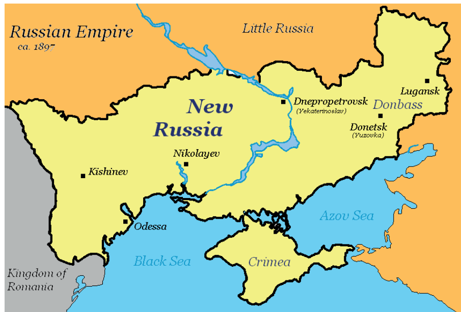
Karte des sogenannten Neurusland während der russischen Zarenzeit (jetzt südliche Ukraine).

Dieser Text wurde zuerst am 02.07.2022 auf www.rubikon.news unter der URL https://www.rubikon.news/artikel/der-kampf-um-neurusland veröffentlicht. Lizenz: Hannes Hofbauer, Rubikon, CC BY-NC-ND 4.0