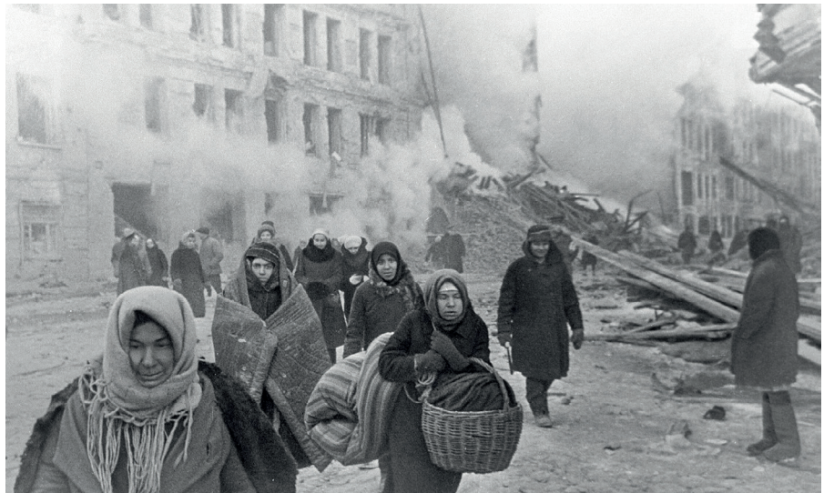
Sowjetische Zivilisten verlassen ihre zerstörten Häuser nach einem Bombardement der Deutschen Armee während des Kampfes um Leningrad, 10 Dezember 1942

Aber auch Hitlers Anweisung, jeden totzuschießen, „der nur schief schau“, war von der Wehrmacht bereits ‚proaktiv‘ in verbrecherische Befehle gegossen worden.