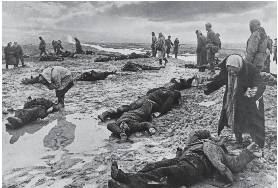
Russische Mütter räumen das Leichenfeld nach der Schlacht bei Kertsch 1942, Foto: Dmitri Baltermanz; Lizenz: gemeinfrei

Dieser Text wurde zuerst am 15.6.2022 auf www.nachdenkseiten.de unter der URL https://www.nachdenkseiten.de/?p=84845 veröffentlicht. Lizenz: Leo Ensel, NachDenkSeiten, CC BY-NC-ND 4.0