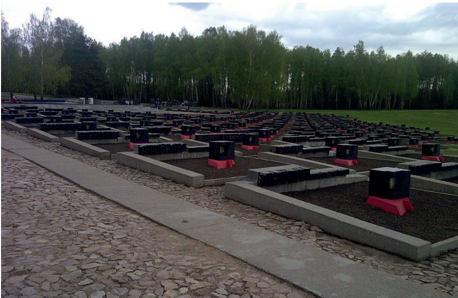
Friedhof der Dörfer in der Gedenkstätte Chatyn: 186 Gräber, für jedes Dorf ein Grab.

gebrannt, Hunderte von ihnen samt der Bevölkerung, die man zuvor in die Dorfscheune oder Kirche gesperrt hatte. Allein für Belarus belaufen sich die Schätzungen auf 300.000 bis 350.000 getötete Menschen. (Wer sich von den Gräueltaten einen Eindruck verschaffen will, sollte die weißrussische Gedenkstätte Chatyn, den „Friedhof der Dörfer“ [1], besuchen oder, wenn er es ertragen kann, sich den Film „Komm und sieh/ Иди и смотри“ [2] von Elen Klimow aus dem Jahre 1985 ansehen.)