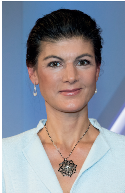
Sarah Wagenknecht

Zugleich verlangt diese Erzählung aber auch gebieterisch eine Neubewertung der Vergangenheit: Wenn nämlich Putin schon immer auf den Krieg gegen die Ukraine und womöglich noch Schlimmeres abzielte, dann erweisen sich natürlich all diejenigen, die bis vor Kurzem noch dafür geworben hatten, die russische Perspektive zumindest mal zur Kenntnis zu nehmen, als „geistige Brandstifter“[10], bestenfalls als „nützliche Idioten“[11], die nun öffentlich Abbitte und Buße zu leisten haben. Die ehemalige ARD-Moskaukorrespondentin Gabriele Krone-Schmalz, der gerade von seinem Posten als Vorsitzender des Deutsch-Russischen