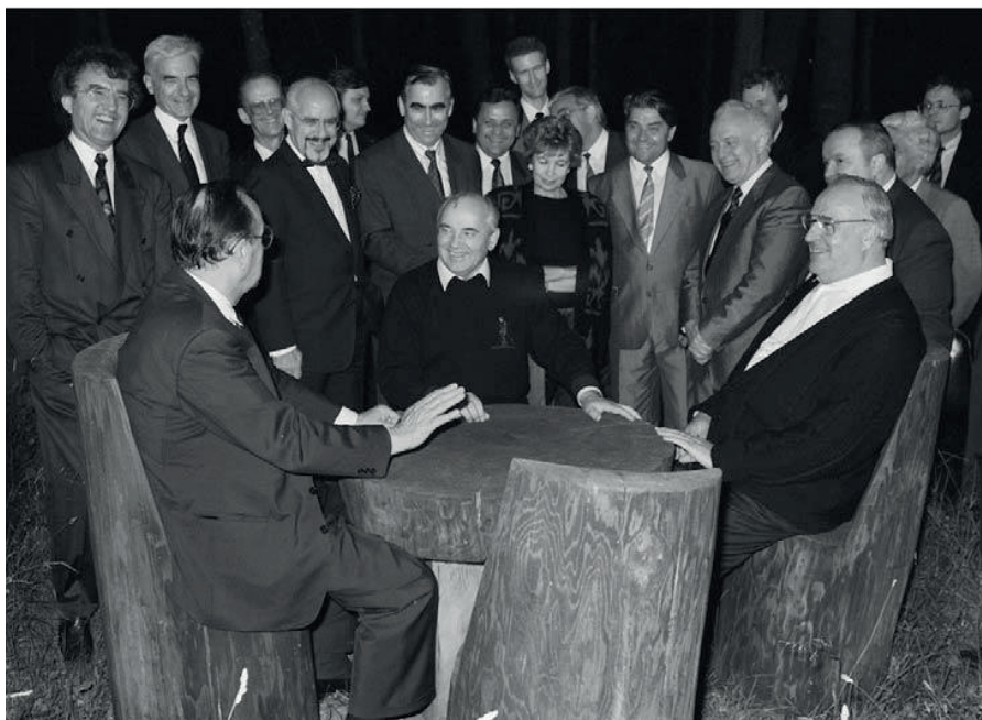
Michail Gorbatschow bei Verhandlungen zur deutschen Wiedervereinigung mit Hans-Dietrich Genscher und Helmut Kohl in Russland, am 15.7.1990

stützter Kurz- und Mittelstreckenraketen bis zur Kündigung des Open-Skies-Treaty – unter die Lupe nehmen. Sie würde die Bedeutung des weltweiten amerikanischen Raketenabwehrsystems Aegis mit seinen angriffsfähigen Modulen unmittelbar vor der russischen Haustür in Rumänien und Polen würdigen. Und sie würde die diversen vom Westen offen oder clandestin unterstützten Regime-Change-Versuche in Osteuropa und im postsowjetischen Raum von Serbien, Georgien, Kirgistan bis zum Euromaidan in Kiew nicht vergessen.