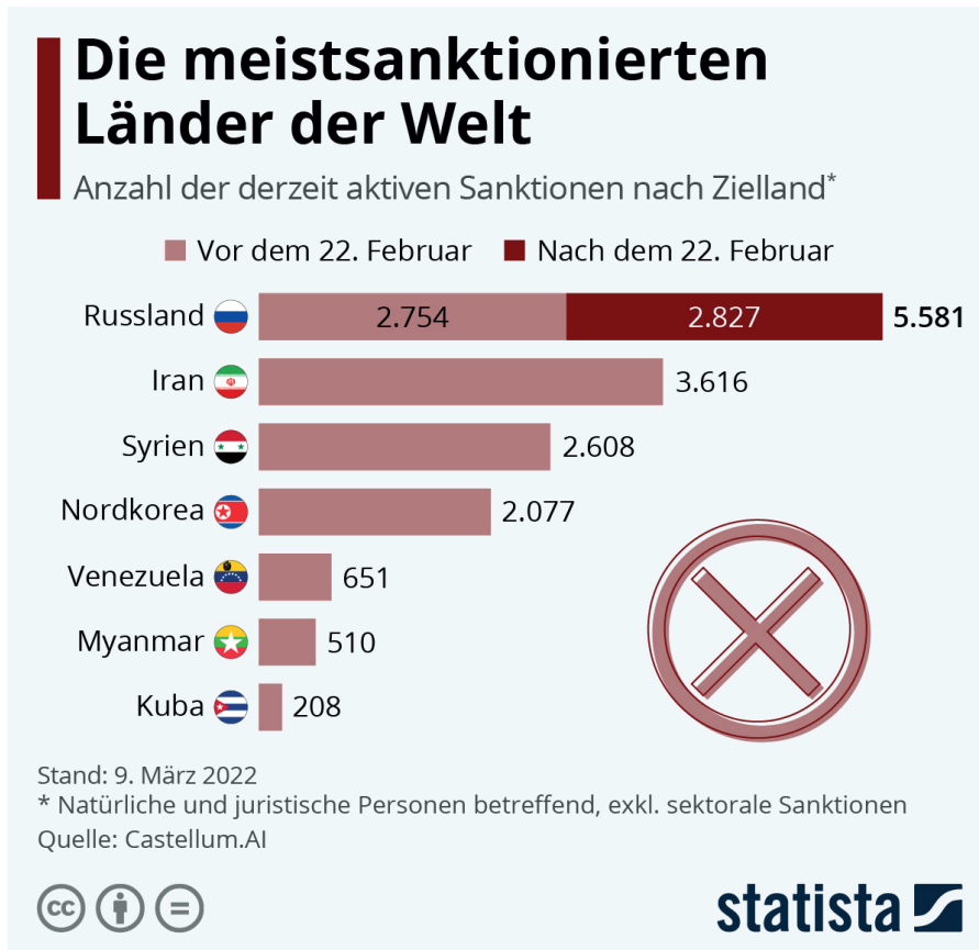
Die meistsanktionierten Länder der Welt (Statista)

Die Frage ist: Wie deuten, wie interpretieren wir diese Fakten? In welche Geschichte ordnen wir sie ein? Genau-