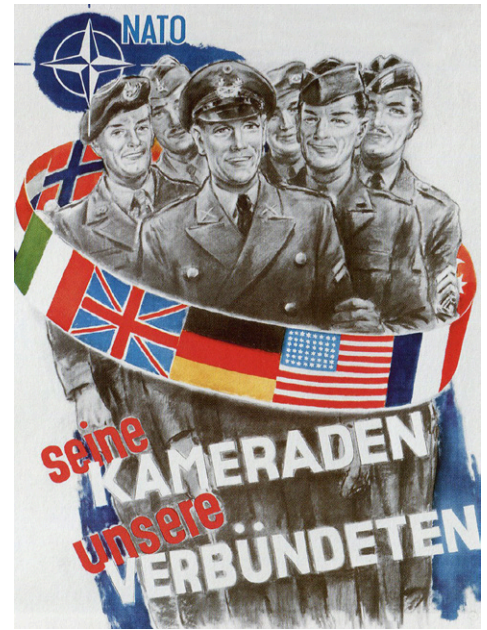
Plakat NATO „Seine Kameraden - unsere Verbündeten“, 1960 Illustration: Helmuth Ellgaard, Wikimedia.org, CC BY-SA 3.0)