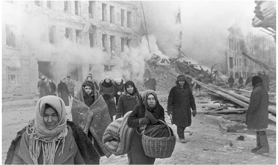
Sowjetische Zivilisten verlassen ihre zerstörten Häuser nach einem Bombardement der Deutschen Armee während des Kampfes um Leningrad, 10 Dezember 1942

Aber auch Hitlers Anweisung, jeden totzuschießen, „der nur schief schau“, war von der Wehrmacht bereits ‚proaktiv‘ in verbrecherische Befehle gegossen worden.