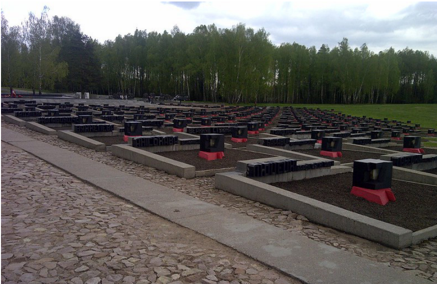
Friedhof der Dörfer in der Gedenkstätte Chatyn: 186 Gräber, für jedes Dorf ein Grab.

gebrannt, Hunderte von ihnen samt der Bevölkerung, die man zuvor in die Dorfscheune oder Kirche gesperrt hatte. Allein für Belarus belaufen sich die Schätzungen auf 300.000 bis 350.000 getötete Menschen. (Wer sich von den Gräueltaten einen Eindruck verschaffen will, sollte die weißrussische Gedenkstätte Chatyn, den „Friedhof der Dörfer“ [1], besuchen oder, wenn er es ertragen kann, sich den Film „Komm und sieh/ Иди и смотри“ [2] von Elen Klimow aus dem Jahre 1985 ansehen.)