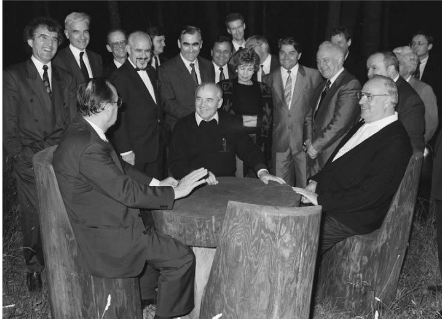
Michail Gorbatschow bei Verhandlung zur deutschen Wiedervereinigung mit Hans-Dietrich Genscher und Helmut Kohl in Russland, am 15.7.1990

stützter Kurz- und Mittelstreckenraketen bis zur Kündigung des Open-Skies-Treaty – unter die Lupe nehmen. Sie würde die Bedeutung des weltweiten amerikanischen Raketenabwehrsystems Aegis mit seinen angriffsfähigen Modulen unmittelbar vor der russischen Haustür in Rumänien und Polen würdigen. Und sie würde die diversen vom Westen offen oder clandestin unterstützten Regime-Change-Versuche in Osteuropa und im postsowjetischen Raum von Serbien, Georgien, Kirgistan bis zum Euromaidan in Kiew nicht vergessen.