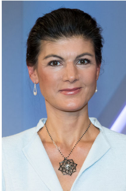
Sarah Wagenknecht

Zugleich verlangt diese Erzählung aber auch gebieterisch eine Neubewertung der Vergangenheit: Wenn nämlich Putin schon immer auf den Krieg gegen die Ukraine und womöglich noch Schlimmeres abzielte, dann erweisen sich natürlich all diejenigen, die bis vor Kurzem noch dafür geworben hatten, die russische Perspektive zumindest mal zur Kenntnis zu nehmen, als „geistige Brandstifter“[10], bestenfalls als „nützliche Idioten“[11], die nun öffentlich Abbitte und Buße zu leisten haben. Die ehemalige ARD-Moskaukorrespondentin Gabriele Krone-Schmalz, der gerade von seinem Posten als Vorsitzender des Deutsch-Russischen