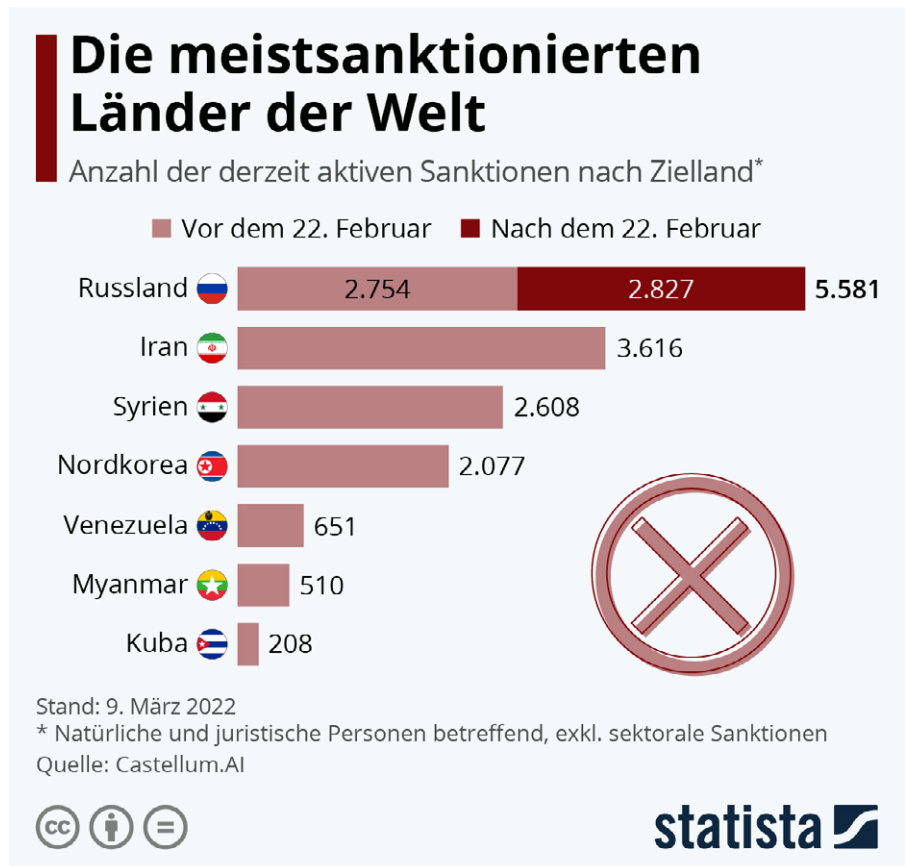
Die meistsanktionierten Länder der Welt

Die Frage ist: Wie deuten, wie interpretieren wir diese Fakten? In welche Geschichte ordnen wir sie ein? Genau-