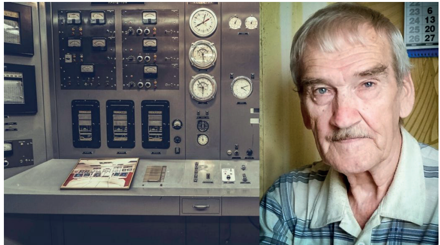
Stanislaw Petrow, der Mann der die Welt gerettet hat.

Dieser Text wurde zuerst am 04.06.2022 auf www.infosperber.ch unter der URL https://www.infosperber.ch/politik/der-mann-der-die-welt-vor-einem-atomkrieg-rettete-teil-2/ veröffentlicht. Lizenz: Leo Ensel, Infosperber, CC BY-NC-ND 4.0