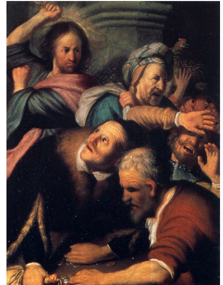
Christus vertreibt die Geldwechslers aus dem Tempel (Gemälde: Rembrandt von 1626, Pushkin Museum of Fine Arts, Wikimedia, public domain)

MF: Sie haben viel über die Dollar-Hegemonie gesprochen und geschrieben. Auch darüber, was jetzt mit der Ent-Dollarisierung geschieht. Können Sie meinen Zuhörern bitte zunächst erklären, was die Dollar-Hegemonie ist und wie sie der wohlhabenden Klasse in den Vereinigten Staaten zugute gekommen ist?