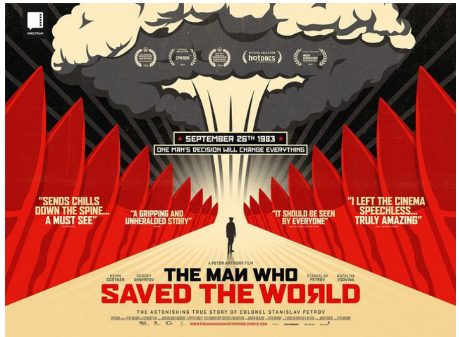
Filmplakat des dänischen Filmes The Man Who saved The World .

Der eigentliche Skandal aber ist – und da kann man dem deutschen Journalisten Klaus Jürgen Schmidt, der das ge-