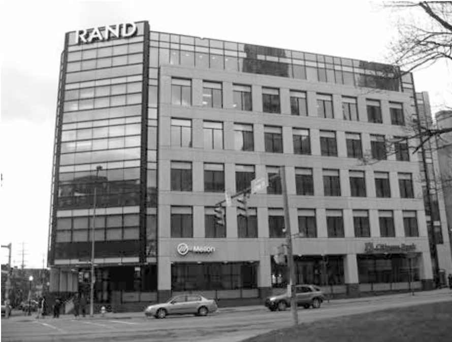
RAND Corporation, Gebäude in Pittsburgh, Pennsylvania. Das Projekt RAND wurde 1946 gegründet, um die militärische Planung besser mit Forschungs- und Entwicklungsentscheidungen in den USA zu verknüpfen. In den letzten Jahren gehörten unter anderem Strategien zur Destabilisierung Russlands zu den Arbeitsthemen. Am 5. September 2019 organisierte die Rand Corporation ein Treffen im US-Repräsentantenhaus, um ihren Plan zu erläutern: Russland schwächen, indem man es zwingt, zuerst in Kasachstan, dann in der Ukraine und dann in Transnistrien einzugreifen [4].

wegs. Aber McCain ist auch der Präsident des IRI (International Republican Institute), dem republikanischen Zweig des NED (National Endowment for Democracy). Es ist bekannt, dass die IRI rund hundert Seminare für die Führer der ukrainischen politischen, rechtsstehenden Parteien, einschließlich Banderisten, durchgeführt hat. Die Senatoren wenden sich an Offiziere des Asowschen Regiments, der wichtigsten paramilitärischen „Banderisten“-Formation. Dies sollte keine Überraschung sein.