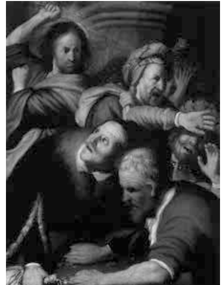
Christus vertreibt die Geldwechslers aus dem Tempel (Gemälde: Rembrandt von 1626, Pushkin Museum of Fine Arts,)

MF: Sie haben viel über die Dollar-Hegemonie gesprochen und geschrieben. Auch darüber, was jetzt mit der Ent-Dollarisierung geschieht. Können Sie meinen Zuhörern bitte zunächst erklären, was die Dollar-Hegemonie ist und wie sie der wohlhabenden Klasse in den Vereinigten Staaten zugutegekommen ist?