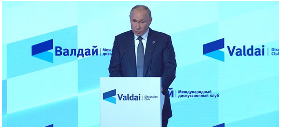
Vladimir Putin deltog i et plenarmøde på det 18. årsmøde i Valdai International Discussion Club. 21.10.2021.

Taiwan "deler amerikanske værdier", siger hans regering. Det er ikke klart. Interessant nok presser nogle i hans progressive partibestyrrelse på for "krigsbeføjelser" til Biden på grund af Taiwan, samtidig med at det er dem, der insisterer mest på radikale klimapolitikker.