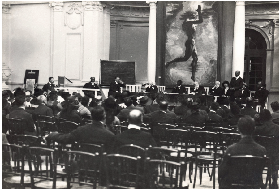
Zweiter Panafrikanischer Kongress im Palais Mondial im September 1921

Dieser Text wurde zuerst am 15.01.2022 auf www.roarmag.org unter der URL < https://www.roarmag.org/esays/modibo-kadalie-interview/ > veröffentlicht. Lizenz: A. Zonneveld & M. Kadalie, CC BY-NC-ND 4.0