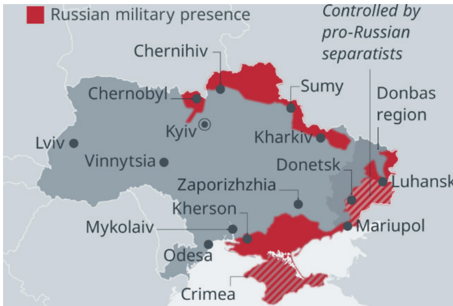
Stand vom 17.03.22.

bildet ist, schnell reagiert, sich in zivile Gebiete einschleicht und nach Belieben angreift.