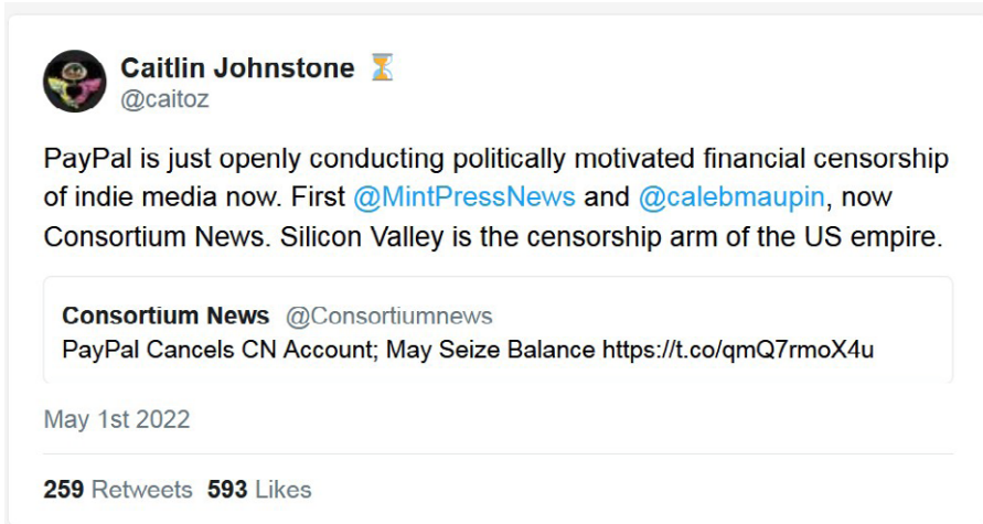
Screenshot Twitter: Wenn Russland es macht ist es Desinformation. Wenn es die Ukraine macht ist es Folklore.

nur, solange niemand ihre Kritik an der Regierung hört.