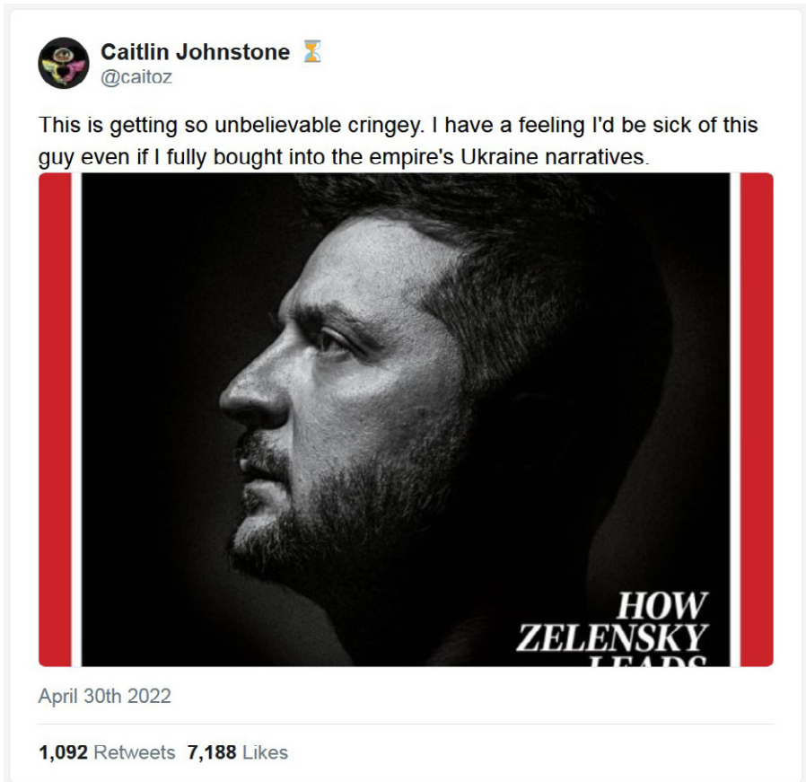
Das wird so unglaublich zum Kotzen. Ich habe das Gefühl, dass ich diesen Kerl auch dann satt hätte, wenn ich die Ukraine-Narrative des Imperiums voll und ganz glauben würde.