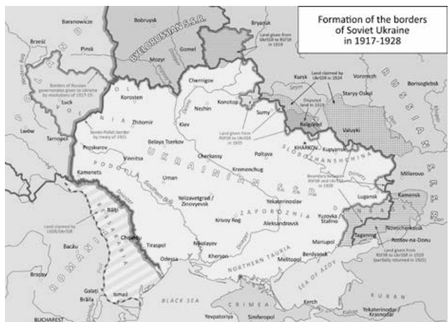
Grenzen der Ukrainischen Sozialistischen Sowjetrepublik in den Jahren 1917-1928

Im Februar 1919 wurde die Donezk-Kriworosch-Republik auf Initiative Lenins aufgelöst. Die Sowjetmacht in der