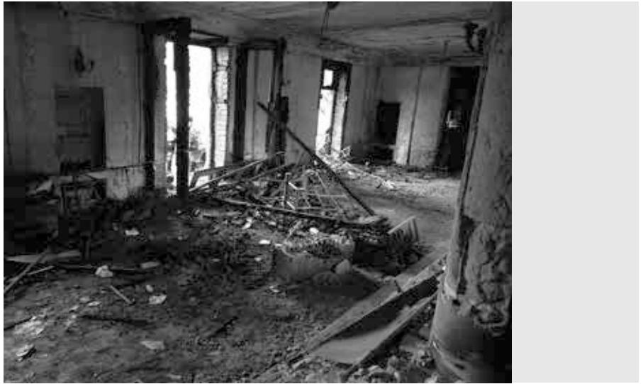
Im Inneren des Gewerkschaftshauses in Odessa nach dem Feuer

Eine komplette Video-Aufzeichnung der Konferenz ist bis heute im Internet abrufbar [10]. Aber leider gibt es keine schriftliche Broschüre mit den Konferenzbeiträgen. Und es gibt auch bis heute keine deutschsprachige Dokumentation über alle Menschenrechtsverletzungen und Einschränkungen der Medienfreiheit in der Ukraine. So ist es für Menschen, die weder Russisch noch Ukrainisch können, enorm schwer, sich ein Bild von den wirklichen Zuständen in der Ukraine zu machen und sich mit Faktenwissen an Diskussionen zu beteiligen.