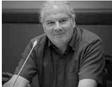
Bundestagsabgeordneter von Die Linke, Andrej Hunko.

Die Menschen in den Volksrepubliken scheinen so etwas wie Aussätzige zu sein. Denn es ist vonseiten des Auswärtigen Amtes noch nicht mal erwünscht, dass