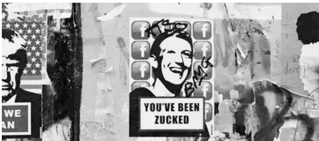
„You’ve been zucked.” London Street art Shoreditch. Shot on film, Kodak Portra 800, Nikon FM2n – Foto Annie Spratt fra Unsplash. Public Domain.

Dette indebærer store risici for demokratiet. Der foreligger tilta-