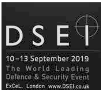
Foto: DSEI 2019 Logo. CC BY-SA 4.0 < https://en.wikipedia.org/wiki/DSEI#/media/File:DSEI_2019.jpg >

keafstemninger blevet iværksat for at yde tjenester for britiske udenrigspolitiske interesser?