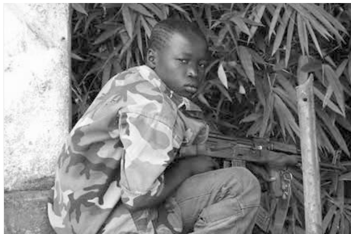
Aethos/Aegis Defense Services, opkøbt af GardaWorld har fremkaldt betydelige kontroverser omkring behandlingen af civile i Irak, af rekruttering af børnesoldater i Sierra Leone, m.m.

Samme Turnbull havde grundlagt Aethos, den ”strategiske kommunikationsafdeling” af Aegis Defense Services, en gigantisk, britisk militæraktionær, der er opkøbt af det endnu større canadiske firma GardaWorld. Sammen har disse virksomheder fremkaldt betydelige kontroverser omkring behandlingen af civile i Irak, af rekruttering af børnesoldater i Sierra Leone, samt ”taktisk inkompetence” i Afghanistan, bare for at nævne et par ting.