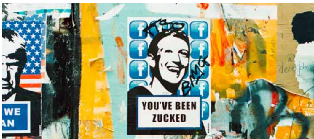
„You’ve been zucked.” London Street art Shoreditch. Shot on film, Kodak Portra 800, Nikon FM2n – Foto Annie Spratt fra Unsplash. Public Domain.

Dette indebærer store risici for demokratiet. Der foreligger tilta-