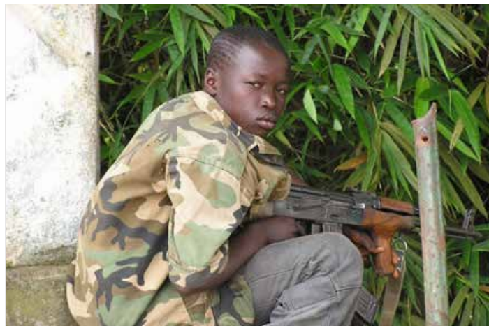
Aethos/Aegis Defense Services, opkøbt af GardaWorld har fremkaldt betydelige kontroverser omkring behandlingen af civile i Irak, af rekruttering af børnesoldater i Sierra Leone, m.m.

Samme Turnbull havde grundlagt Aethos, den ”strategiske kommunikationsafdeling” af Aegis Defense Services, en gigantisk, britisk militæraktionær, der er opkøbt af det endnu større canadiske firma GardaWorld. Sammen har disse virksomheder fremkaldt betydelige kontroverser omkring behandlingen af civile i Irak, af rekruttering af børnesoldater i Sierra Leone, samt ”taktisk inkompetence” i Afghanistan, bare for at nævne et par ting.