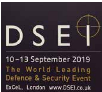
Foto: DSEI 2019 Logo. CC BY-SA 4.0 < https://en.wikipedia.org/wiki/DSEI#/media/File:DSEI_2019.jpg >

keafstemninger blevet iværksat for at yde tjenester for britiske udenrigspolitiske interesser?