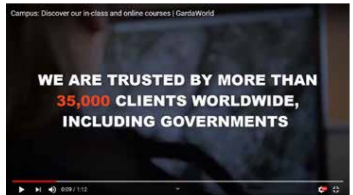
”Campus: Discover our in-class and online courses | GardaWorld”. 13.09.2019. < https://www.youtube.com/watch?v=Ggx9BdnMogM >

Mellem 2007 og 2011 modtog Bell Pottinger[29] 540 mio. dollars fra det amerikanske forsvarsministerium for ”informati- onsoperationer og psykologiske operationer.”