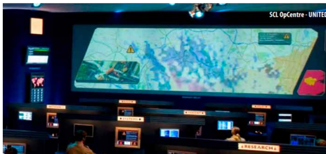
Foto: SCL Opcentre i Storbritannien. Screenshot fra SCL_ELECTIONS_BROCHURE.pdf, side 19 (arkiveret) < https://web.archive.org/web/20131115092428/http://scelelections.com/brochure/SCL_ELECTIONS_BROCHURE.pdf?phpMyAdmin=4BuvSyT03AH1Ak2Ez9nb6VyyjG4 >

Dette udenrigspolitiske forhold rejser et akavet spørgsmål: Er firmaets nuværende Facebook-kampaner til at påvirke nationale fol-